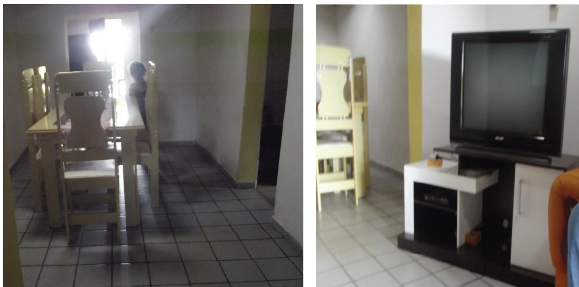
Figura 3: A modernização das habitações na comunidade quilombola do Grilo Fonte de pesquisa - Junho de 2012

Atualmente, na maioria das residências existem um ou mais veículo. Os tipos de locomoção utilizados pelas famílias são: carro, moto, bicicleta e jegue.