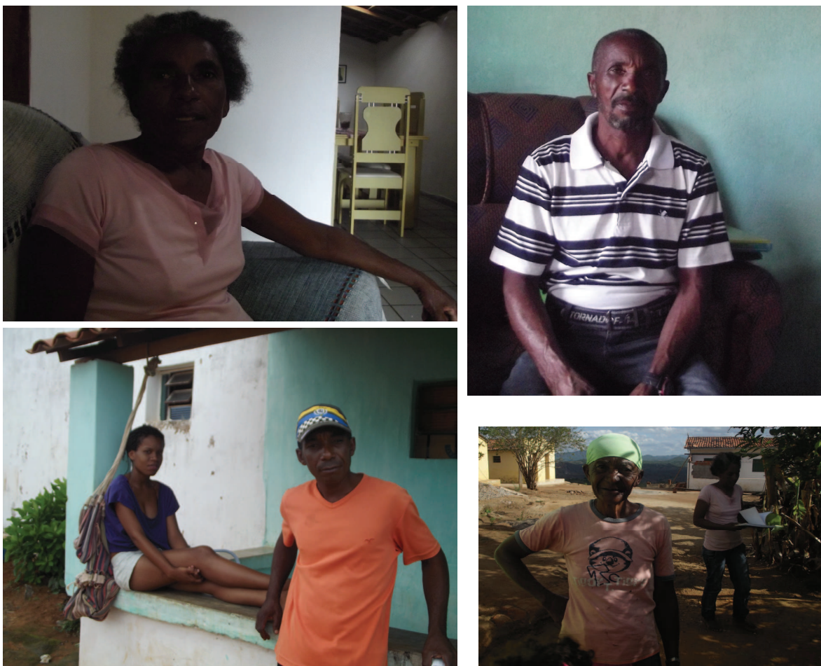
Figura 2: Perfil da comunidade quilombola do Grilo Fonte de pesquisa - Junho de 2012

Em contato com a comunidade, foi possível comprovar a atual situação da comunidade quilombola do Grilo e os aspectos que ainda permanecem desde a sua origem, como é possível observar em seqüência.