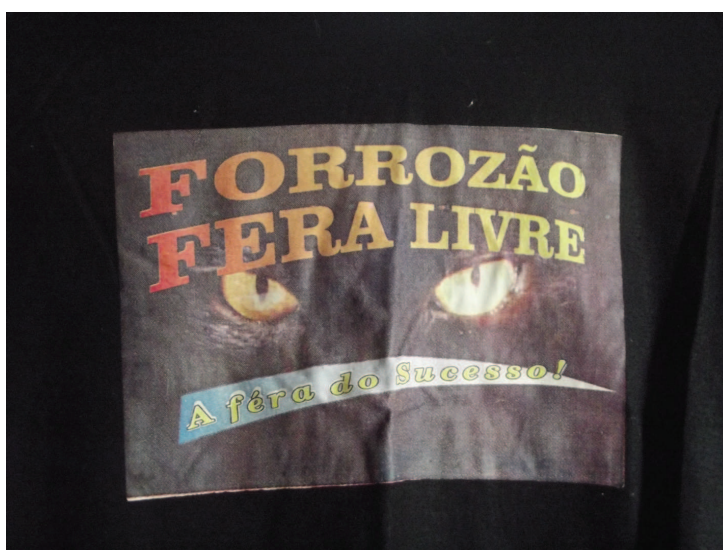
Figura 6: Publicidade da Banda Forrozão Fera Livre, original da Comunidade do Grilo. Fonte de pesquisa - Junho de 2012

Como referência musical dessa comunidade, existe hoje uma banda de forró da comunidade chamada Fera Livre, a qual já se apresentou em diversos lugares fora da comunidade.