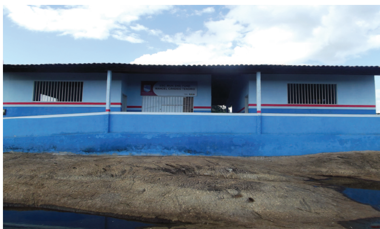
Figura 4: Grupo Escolar Manoel Cândido Tenório Fonte de pesquisa - Junho de 2012