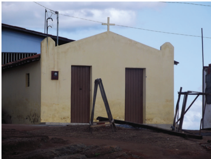
Figura 5: Capela da comunidade quilombola do Grilo Fonte de pesquisa - Junho de 2012

A questão religiosa ainda é muito forte na comunidade. Atualmente a religião que predomina é a religião católica, mas existe o fortalecimento da religião evangélica, presente através da Igreja Assembléia de Deus.