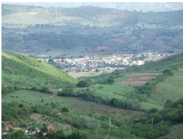
Figura 1: Vista parcial da comunidade quilombola do Grilo Fonte de pesquisa - Junho de 2012

Os remanescentes quilombolas, nas suas “invisíveis” localidades estão conseguindo ser vitoriosos, além da importante vitória jurídica pela legalização de suas terras é o fato de poderem ter sob estudos e pesquisas acadêmicas, histórias de seus costumes e tradições que rememoradas pelos próprios remanescentes quilombolas, a exemplo do que vem acontecendo na comunidade do Grilo.