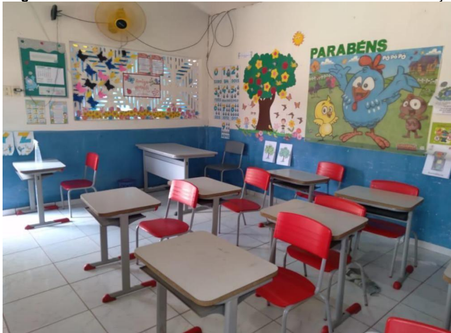
Figura 1- Sala de referência do Pré-II da Creche Luzia Santos de Araújo