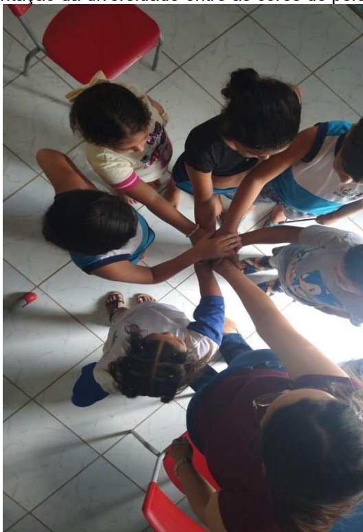
Figura 10 – Representação da diversidade entre as cores de pele na sala de referência