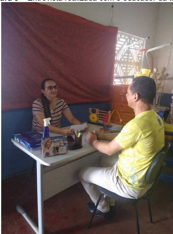
Figura 5 – Entrevista realizada com o educador da turma