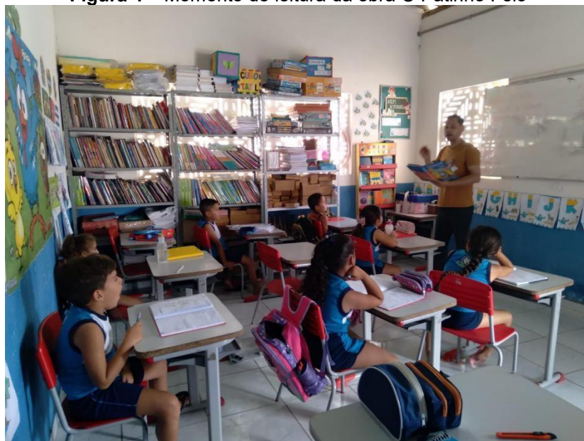
Figura 4 – Momento de leitura da obra O Patinho Feio