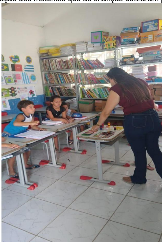
Figura 7 – Apresentação dos materiais que as crianças utilizaram para produzir o cartaz