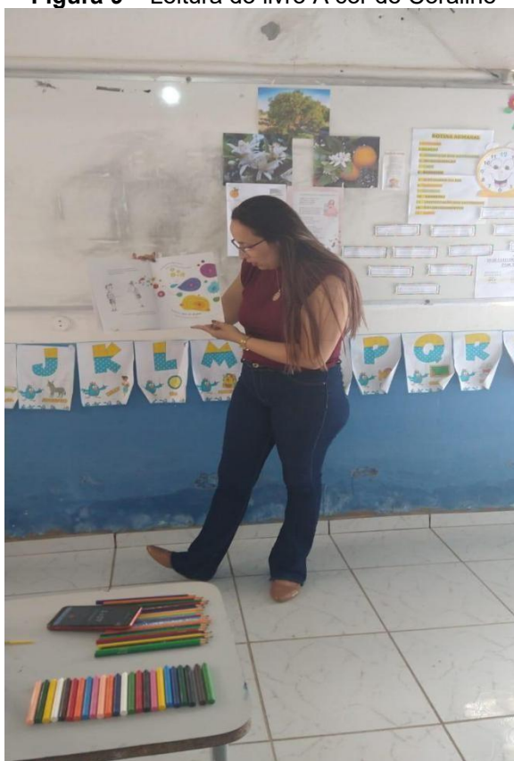
Figura 9 – Leitura do livro A cor de Coraline