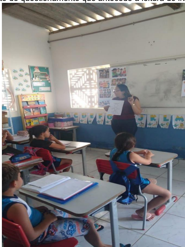
Figura 6 – Momento de questionamento que antecede a leitura do livro A cor de Coraline