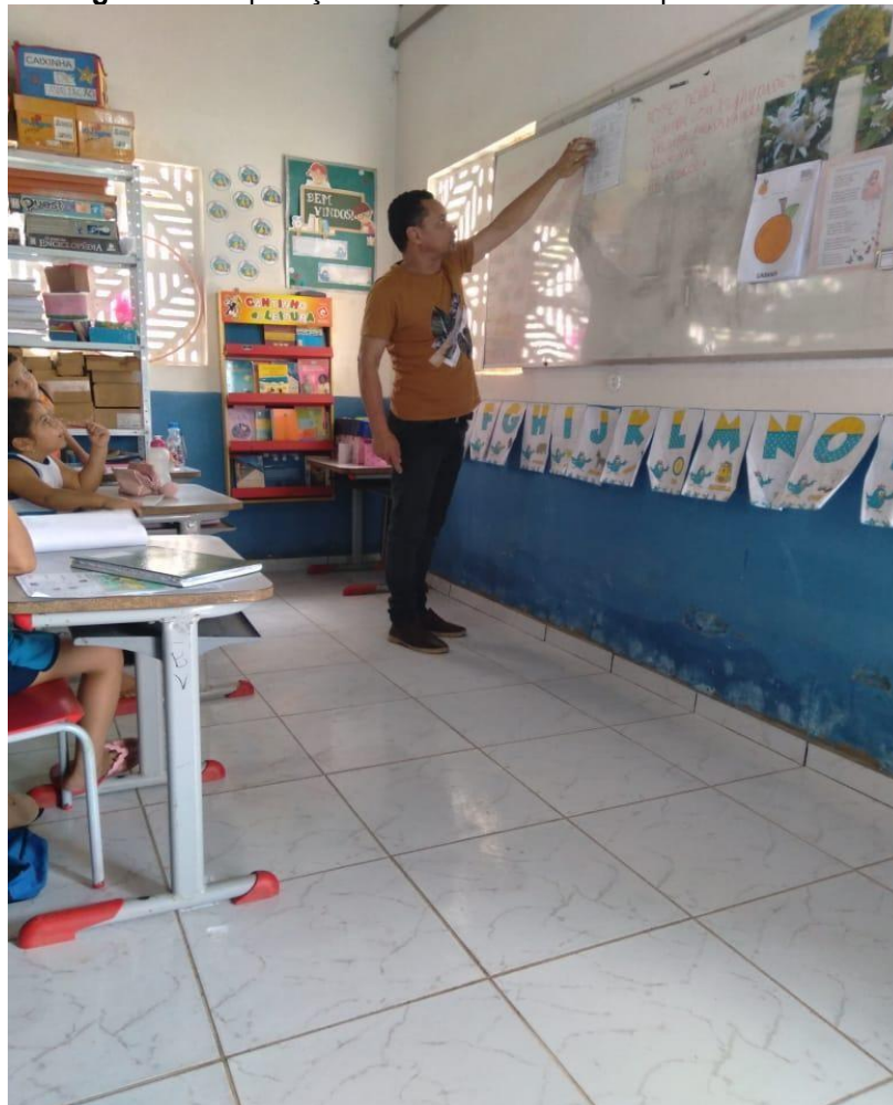
Figura 3 - Explicação da atividade realizada pelo educador