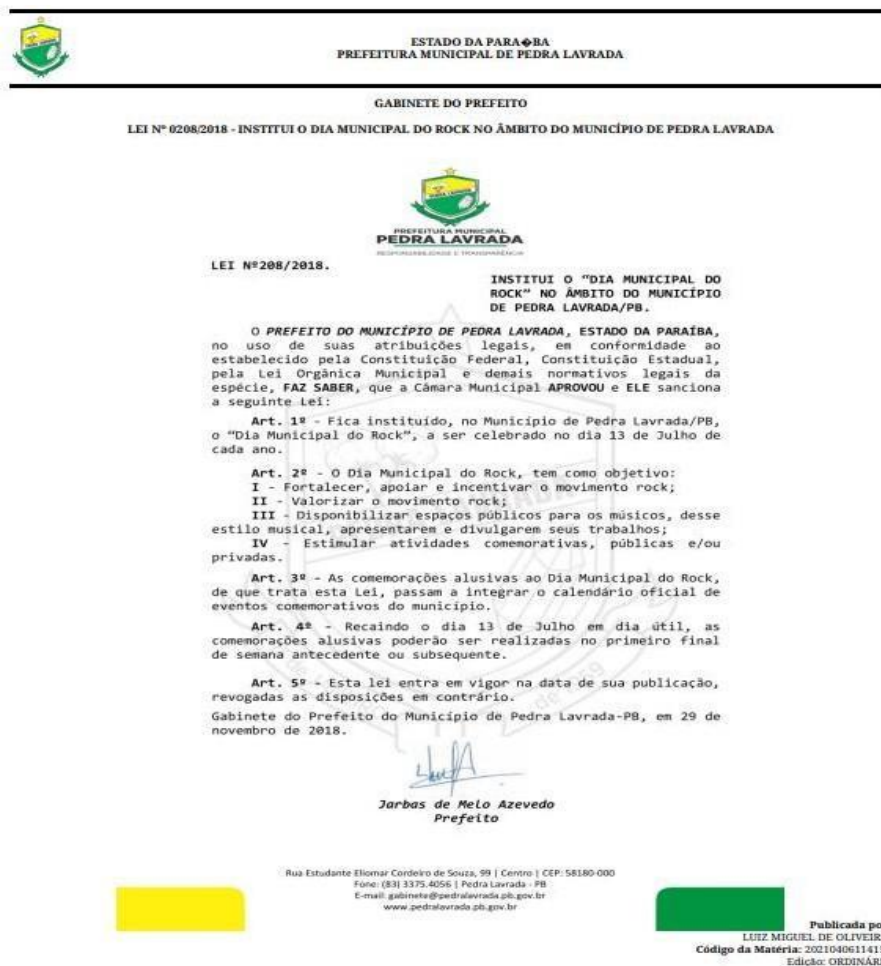
Figura 11: Lei de reconhecimento dos eventos do gênero Rock em Pedra Lavrada - PB