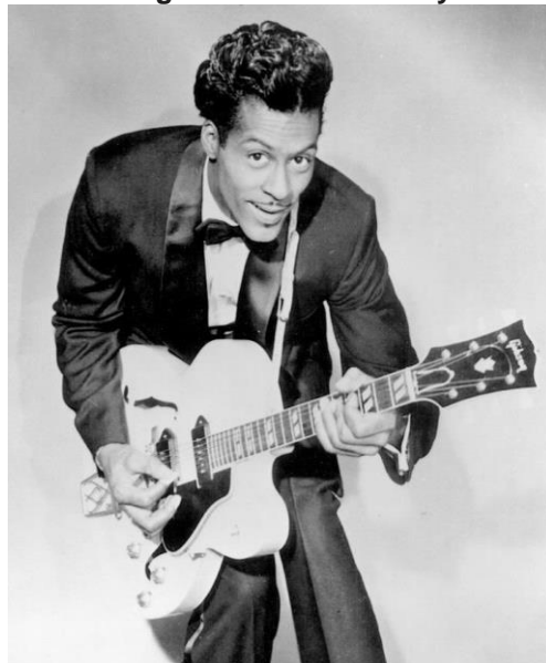
Fotografia 3: Chuck Berry

Seu nome e singularidade musical alcançaram com intensidade a geração dos anos 1950. Influenciados pelo talento original de Berry no uso de guitarra, um som que conseguia atrair não apenas pelas suas letras, que ressaltam assuntos relacionados à vida adolescente e juventude, geralmente relacionados a insatisfação social, Chuck Berry inspirou e influenciou várias camadas sociais da música através de suas letras e ritmos dançantes. Exemplo disso é uma de suas músicas mais famosas, Johnny B. Goode ”, que nos conta a história de um jovem rapaz que mal sabia ler, mas que tinha uma grande habilidade para tocar guitarra e que vivia em condições difíceis de moradia.