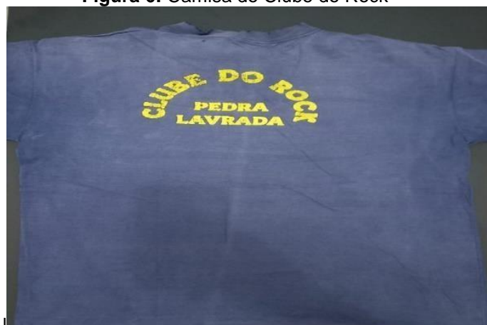
Figura 6: Camisa do Clube do Rock