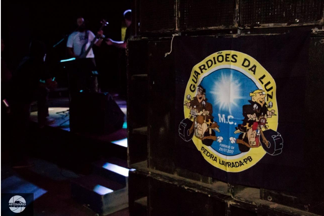
Figura 12: Brasão do Moto Clube Guardiões da Luz de Pedra Lavrada - PB

município conhecido como Guardiões da Luz. Na foto a seguir aparece o brasão desse moto clube de Pedra Lavrada, uma foto de 24 de outubro de 2018, que registrou a entrada dos motos clubes no evento: