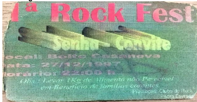
Figura 5: 1ª Rock Fest de Pedra Lavrada