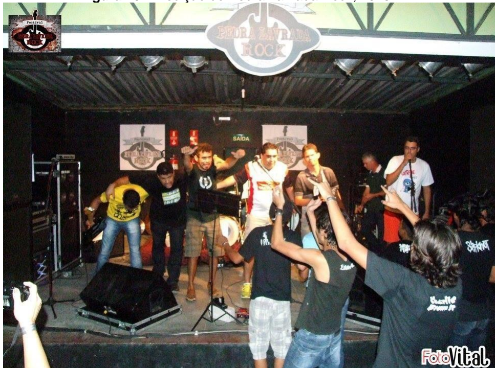
Figura 10: 1ª edição do Pedra Lavrada Rock, 2015.

Um dos exemplos expressivos que também constituem a cena durante os eventos de Pedra Lavrada é a Roda Punk ou Mosh Pit 25 , que têm suas origens mais distantes na Califórnia entre os anos de 1970 e 1980. Esse movimento consiste na abertura de um círculo entre o público, onde as pessoas começam a pular, bater a cabeça conforme o repertório musical das bandas nas apresentações. Na foto a seguir um dos registros onde público se reúne na cena local.