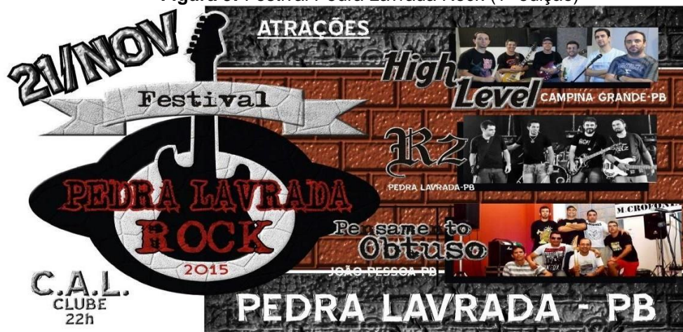
Figura 9: Festival Pedra Lavrada Rock (1ª edição)

Partindo disso, situamos o município de Pedra Lavrada como palco de recepção para as cenas de Rock entre os anos subsequentes aos anos 2000, com a predominância de bandas regionais. Entre os anos de 2015 e 2021 a cidade teve sete edições festivais de Rock, o primeiro festival de rock dentre as sete edições já ocorridas em Pedra Lavrada ocorreu no dia 21 de novembro de 2015 às 22 horas. Na época a festa foi intitulada Festival Pedra Lavrada Rock , tendo como local de apresentação do evento o CAL Clube, que geralmente recebe outros tipos de festividades ao longo do ano como forró. Abaixo segue o banner de divulgação do evento: