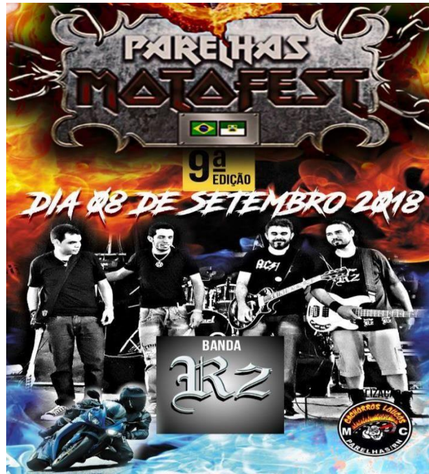
Figura 8: 9ª edição do Motofest de Parelhas