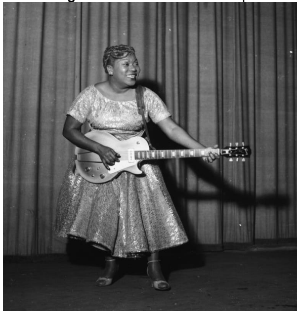
Fotografia 1 – Sister Rosetta Tharpe