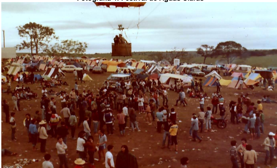
Fotografia 4: Festival de Águas Claras