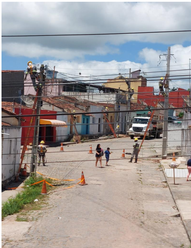
Figura 9 – Fotografia da rua José Francisco de Medeiros, Remígio/PB, com exemplo de poste antigo, a esquerda, e poste novo, a direita.

Dessa forma, os postes antigos estão ficando cada vez mais obsoletos por não suprirem a demanda da cidade. No passado um poste tinha em média sete metros de altura, em dias atuais, a Neoenergia (2021) afirma que um poste de via urbana que pode comportar uma rede de média e baixa tensão, tem em média nove metros de altura depois de fixado ao solo (NEOENERGIA, 2021), a diferença pode ser observada na figura abaixo ( Figura 9 ). Essa ampliação se fez necessária ao longo do tempo para sustentar com mais segurança as redes de média e baixa tensão e, posteriormente, para compactar melhor as redes de telecomunicações, o que vai de encontro com o aumento das demandas por serviços de que Milton Santos (2008) trata.