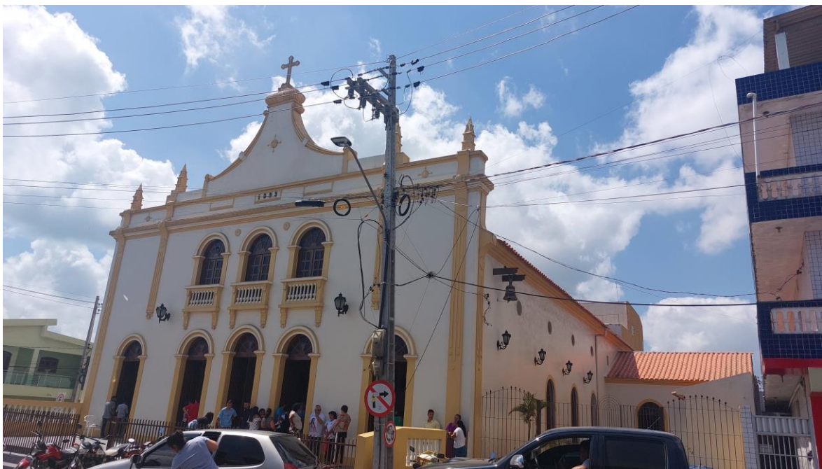
Figura 2 – Fotografia da Igreja Matriz de Remígio/PB.

Na fotografia abaixo, ( Figura 2 ), é possível observar a fachada da Igreja Matriz de Remígio/PB e como ela sofre um empobrecimento estético por conta do poste de concreto e da fiação que ele acomoda.