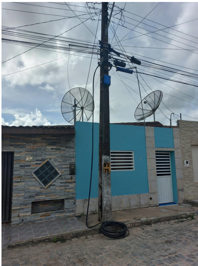
Figura 11 – Fotografia com exemplo de cordoalha rompida e deixada ao chão na rua Manoel Alexandre Filho, Remígio/PB.

Esse mesmo panorama é visto em diversas ruas da cidade, em alguns locais esse emaranhado de fios adentra nas moradias. Já em setores que a rede ficou a uma altura muito baixa, é constante o transtorno e o perigo para os pedestres e motoristas. É comum que algum caminhão passe e se enrosque nesses fios, o que afeta o alinhamento vertical dos postes ainda mais e deixa esse cabeamento em meio as avenidas. Abaixo ( Figura 11 ) podemos observar um desses cabos rompido e debruçado na calçada.