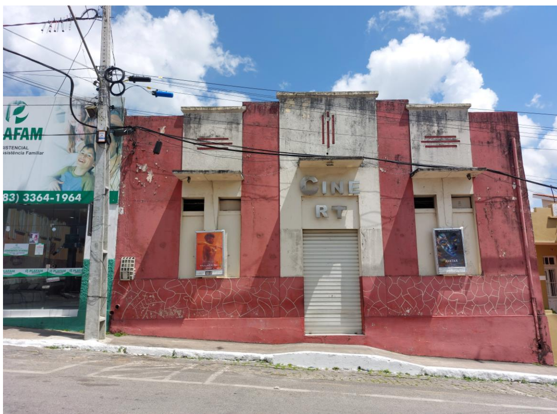
Figura 10 – Fotografia da fachada do Cine RT na rua Governador Flavio Ribeiro Coutinho, Remígio/PB.

Na foto abaixo ( Figura 10 ), podemos observar a fachada do prédio histórico do Cine RT, que fica localizado na rua Governador Flávio Ribeiro Coutinho em Remígio/PB, com destaque para um poste recentemente colocado. É possível observar que a rede elétrica, no primeiro plano, e as redes de internet, no segundo plano, já foram devidamente organizadas, mas no terceiro plano da estrutura está o cabo de telefonia sustentado de forma irregular e apoiado na estrutura do prédio histórico, o que causa um empobrecimento visual e, possivelmente, até a deterioração da fachada por conta do seu peso exagerado aplicado a estrutura.