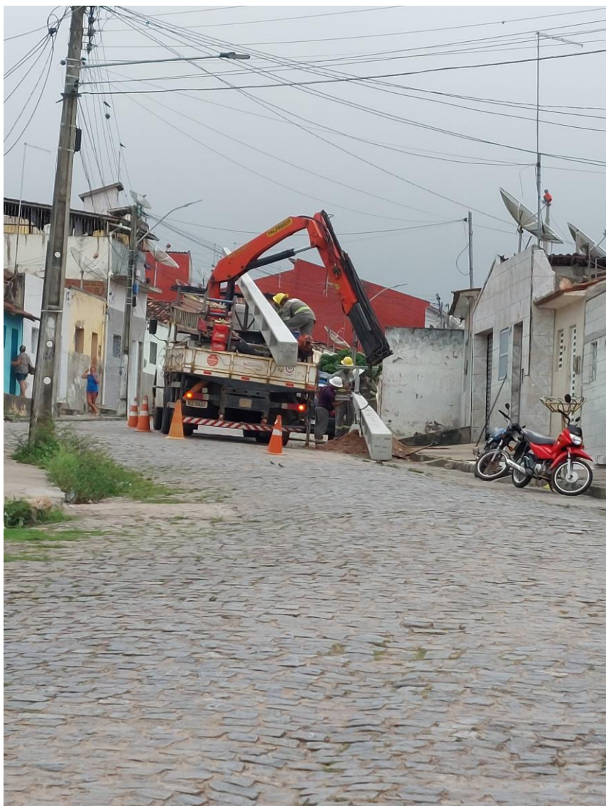
Figura 6 – Fotografia da concessionária de energia fixando poste em Remígio/PB.

Todavia, quando tratamos do meio urbano e do quesito paisagem, o principal problema se cria a partir do momento em que as empresas de energia fazem manutenções na sua rede, como por exemplo, substituir um poste, uma vez que as redes, tanto de energia como de telecomunicações, que se encontravam nos postes antigos são todas jogadas ao chão no momento da manutenção e em seguida realocada nos novos postes. Na imagem abaixo ( Figura 6 ) é possível ver a concessionária de energia fixando um novo poste em uma rua da cidade de Remígio/PB.