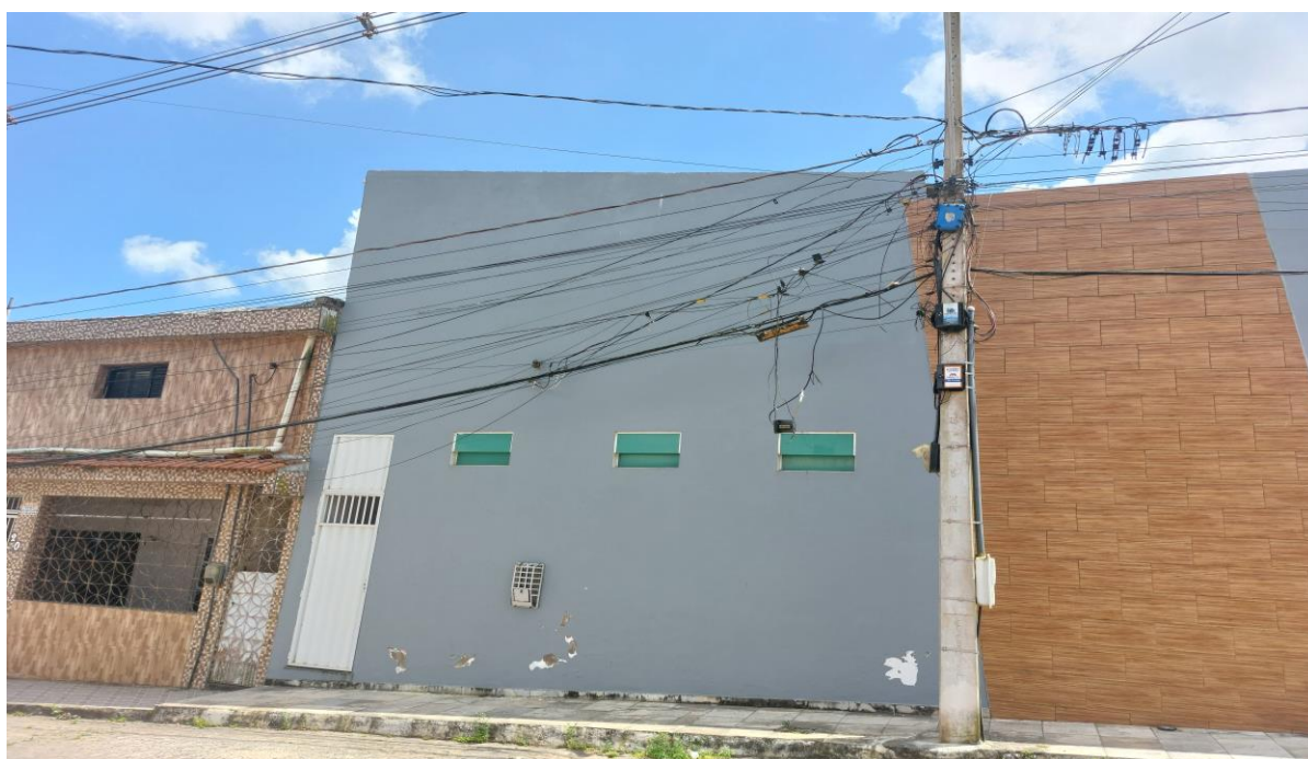
Figura 7 – Fotografia com exemplo de uma rede telefonia alocada de forma irregular num poste na cidade de Remígio/PB.

Uma explicação do desinteresse das empresas de telefonia e dados em recolher os cabos é porque eles não têm cobre, portanto, sem valor econômico. Outra situação é de que a cada serviço contratado, a empresa liga novos fios, sem remover os demais. (SANTOS, 2021).