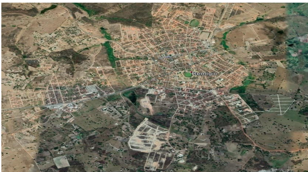
Figura 3 – Remígio/PB Visto por Satélite.

O município de Remígio/PB está localizado na Microrregião do Curimataú Ocidental e na Mesorregião do Agreste Paraibano do estado da Paraíba (IBGE, 2021). Sua área é de 183,459 km 2 (IBGE, 2022). O município está incluído na área geográfica de abrangência do semiárido brasileiro, definida pela Superintendência de Desenvolvimento do Nordeste (SUDENE). Esta delimitação tem como critérios o índice pluviométrico, o índice de aridez e o risco de seca (SUDENE, 2017). Abaixo imagem de Remígio/PB vista por satélite, ( Figura 3 )