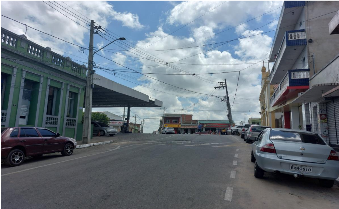
Figura 1 – Fotografia da Rua João Pessoa em Remígio/PB.