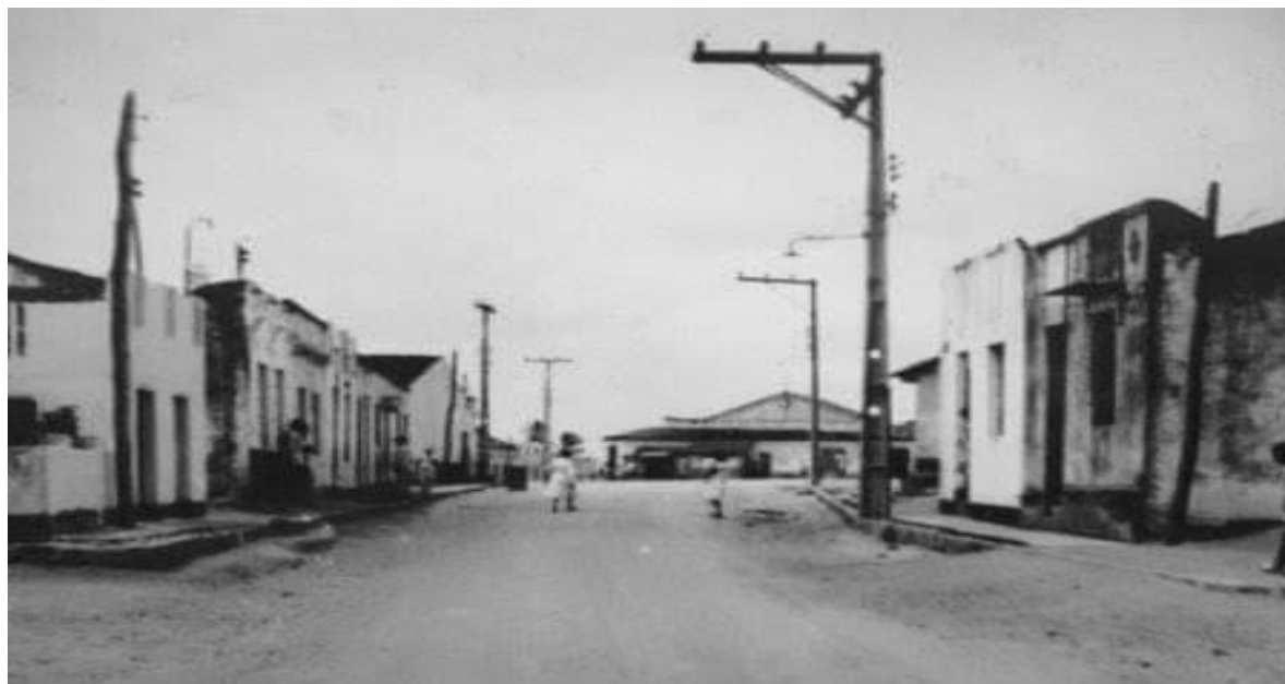
Figura 5 – Rua Idelfonso Jardelino da Costa, Remígio/PB, com destaque para os postes de concreto.