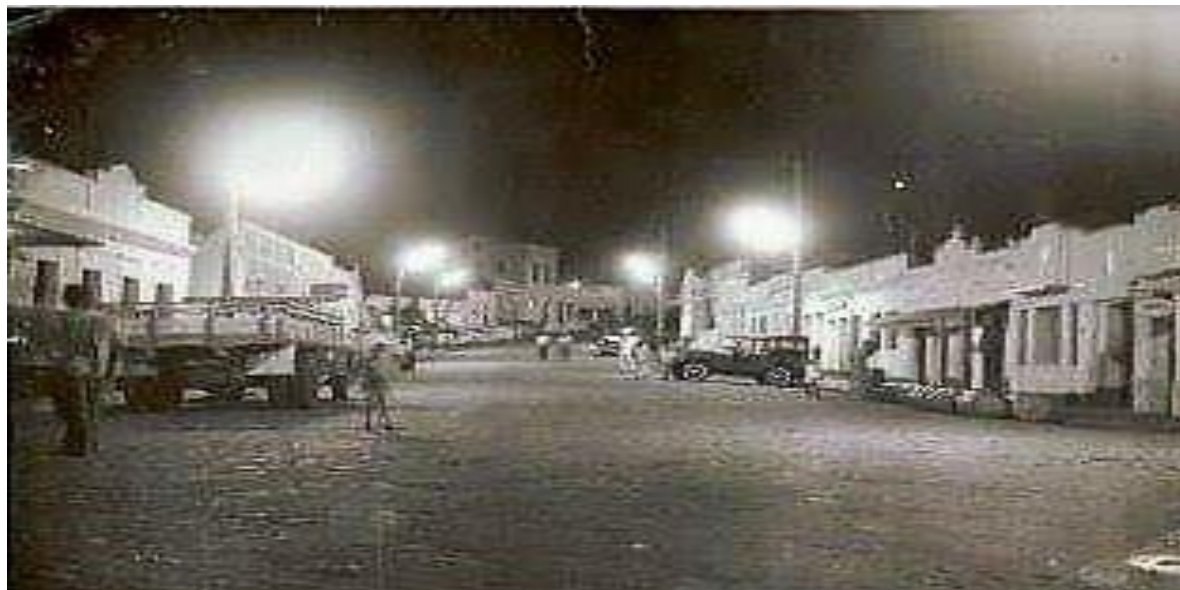
Figura 4 – Rua Governador Flávio Ribeiro Coutinho, em Remígio/PB, com iluminação pública em funcionamento.