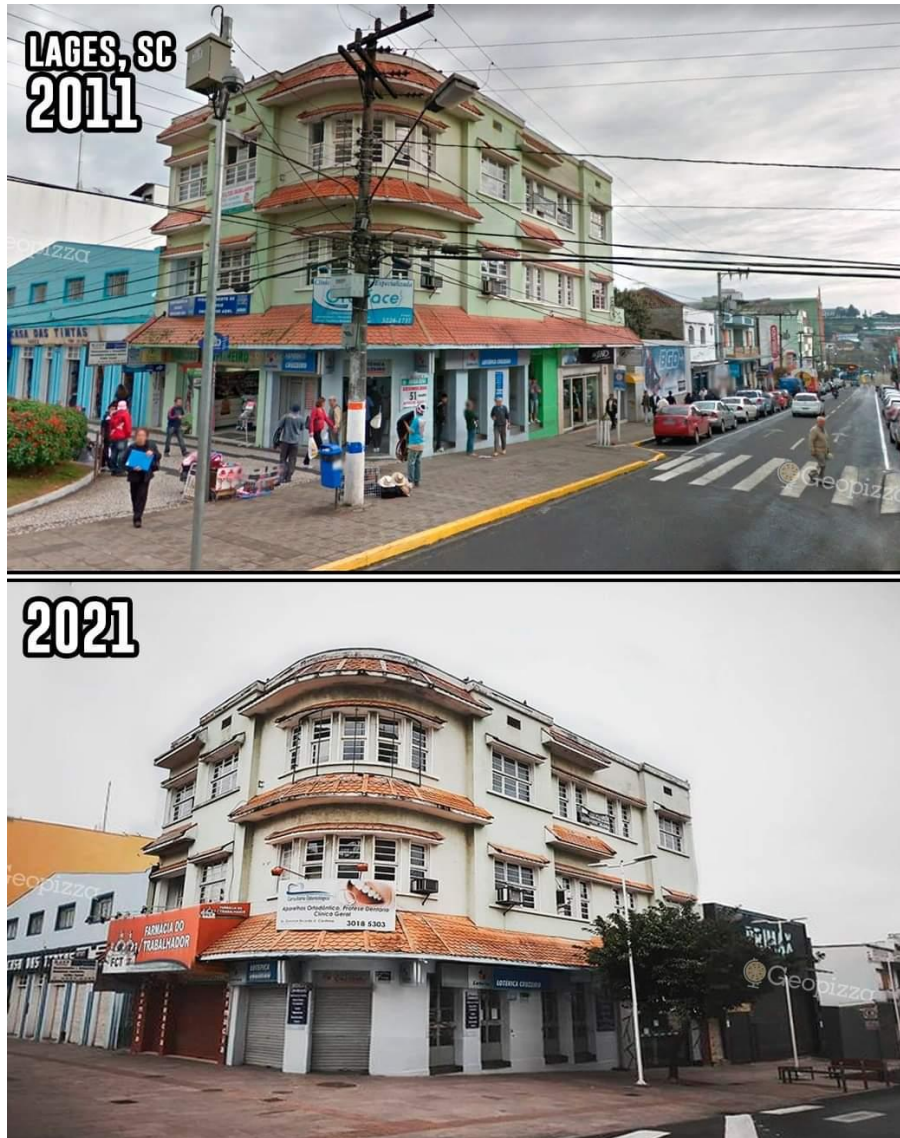
Figura 12 – Rua na cidade de Lajes/SC, antes e depois de ser requalificada.