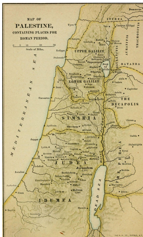
Figura 2: “Uma História do Povo Judeu durante os períodos Macabeus e Romano”. Por James Stevenson Riggs, 1900, Disponível em: Princeton Theological Seminary Library.