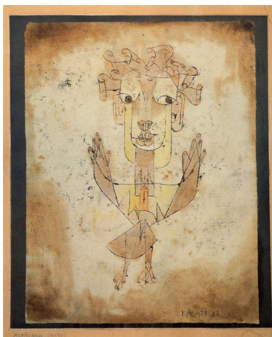
Figura 5: Angelus Novus. Paul Klee, 1920.

O questionamento sobre se o fato de Tibério ser judeu o atrapalhou ou não em sua carreira política como oficial romano é incerto. Contudo, é possível aferir com relativa confiança que os seus pares romanos, pelo menos alguns dos quais tinham desavenças, jamais esqueceram suas origens judaicas. É interessante refletir que, mesmo após ter adotado a cultura romana, Tibério Júlio Alexandre continuou, tudo indica, a ser vítima de antissemitismo. Juvenal, no primeiro discurso de “Sátira”, reclama de passar por estátuas no Fórum Romano que supostamente representavam Tibério. Ele escreveu: “[...] nas quais algum alabarca egípcio teve a audácia de colocar seus próprios títulos. Nesta imagem é correto fazer mais do que urinar.” (Juvenal, Sátiras, 1.129-131). Por mais que o oficial judeu tentasse se desvencilhar de suas origens, não o conseguiu e, pior, reforçou o antissemitismo e sujou as mãos com o sangue do seu próprio povo, que no final, também acabou por rejeitá-lo, jogando-o no esquecimento.