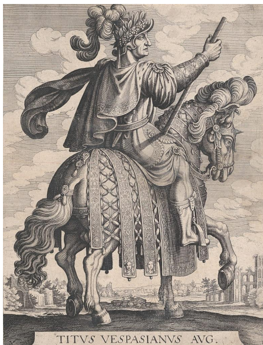
Figura 3: Imperador Tito Vespasiano a Cavallo, de 'Os Doze Primeiros Césares Romanos' depois da Tempestade. Por Matthaus Merian, 1610-50.