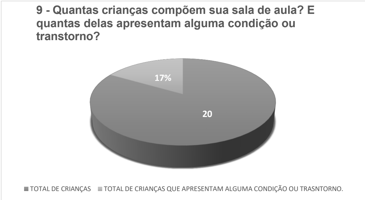
GRÁFICO 2 – Porcentagem da quantidade de crianças que apresentam alguma condição ou transtorno.