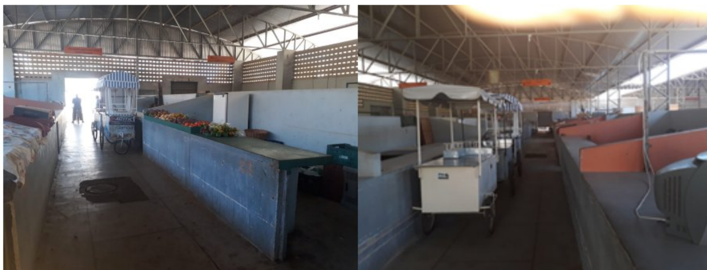
Figura 2 – Estabelecimentos de venda (Mercado Municipal e Açougues) de carnes ovina e caprina no município de Catolé do Rocha – PB, 2019.

Os dados foram obtidos por meio de levantamento, através da aplicação de formulários elaborados com questões semiestruturadas, relacionadas ao perfil dos consumidores e comerciantes de carnes caprina e ovina, podendo ou não os entrevistados opinar com mais de uma resposta (Anexo I). Foram aplicados 300 formulários a consumidores, correspondente a 1% da população estimada do município para o ano de 2019, e 50 formulários aos estabelecimentos de venda do produto (Figura 2). A técnica utilizada foi a entrevista estruturada, quando os dados são coletados com a presença do pesquisador (entrevistador).