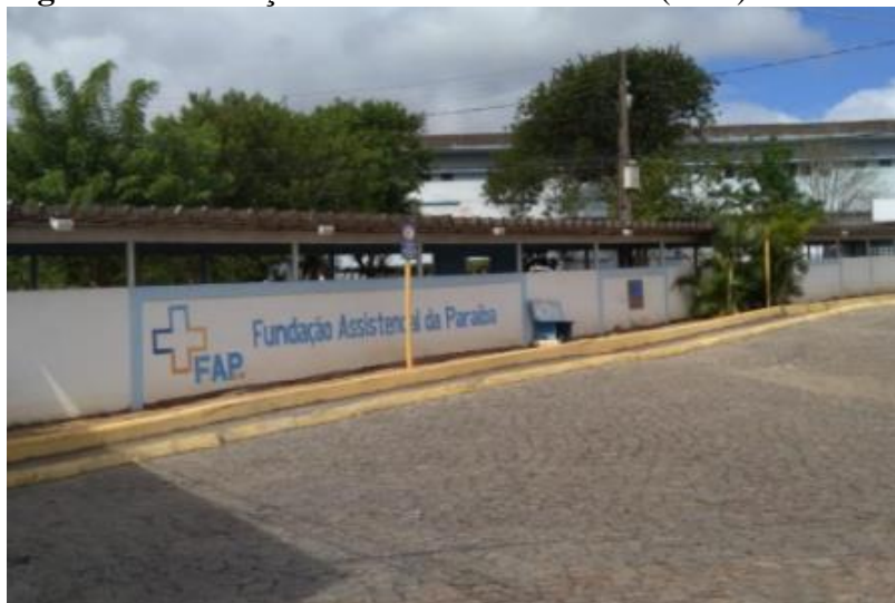
Figura 1 – Fundação Assistencial da Paraíba (FAP)

O trabalho foi realizado na FAP (Figura 1), em Campina Grande - PB, durante o estágio obrigatório do curso de Agroecologia, campus II da UEPB, dos dias 10 de janeiro a 22 de março.