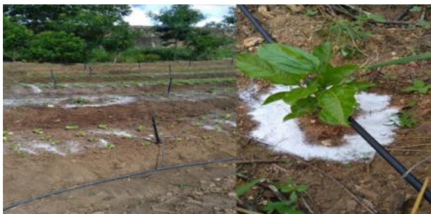
Figura 4 – Calagem em leirões e covas

Mesmo com uma rotina sendo seguida, existem dias atípicos como por exemplo no dia 12/01/2022 que foi identificado por meio de sinais (solo com pouca drenagem, carrapicho) e a análise laboratorial que o solo da área 2 é ácido, dessa forma foi feito uma calagem do solo (figura 4) onde foi aplicado 255g de calcário agrícola em cada berço das culturas da acerola, 150g nos berços da cultura do maracujá e 500g em cada canteiro da área 2, totalizando 55 kg do produto em toda área. No dia 15/02/2022 também ocorreu a prática de espalderamento (figura 5) na cultura do tomate cereja, é um sistema de que orienta o crescimento da planta com a utilização de estacas, arame, embira ou barbante (Coutinho et al, 2008).