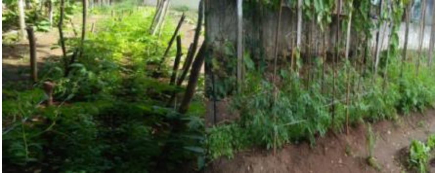
Figura 5 – Espaldeiramento