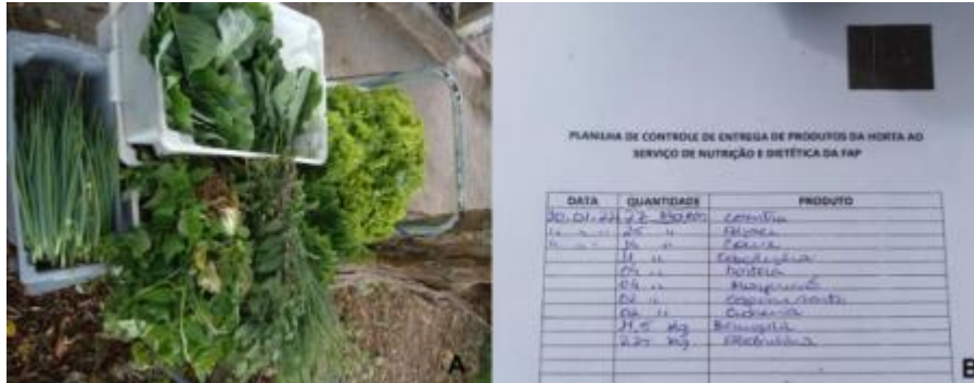
Figura 3 – Colheita e controle semanal