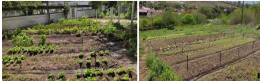
Figura 2 – Área de plantios- Área 1 (A) e Área 2 (B).

A produção da área 1 é mais focada nas culturas do coentro, alface e couve e etc, já na área 2, além de todas as culturas citadas, existem também frutíferas como: acerola, maracujá e mamão. Além de todas essas culturas, nas duas áreas são cultivadas também as culturas da cebolinha, abobrinha, manjerição, berinjela, tomate cereja e plantas medicinais como capim santo, erva-cidreira entre outros.