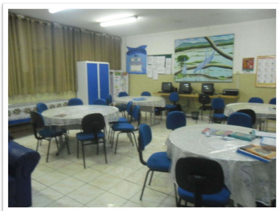
Figura 2: Sala de Professores.