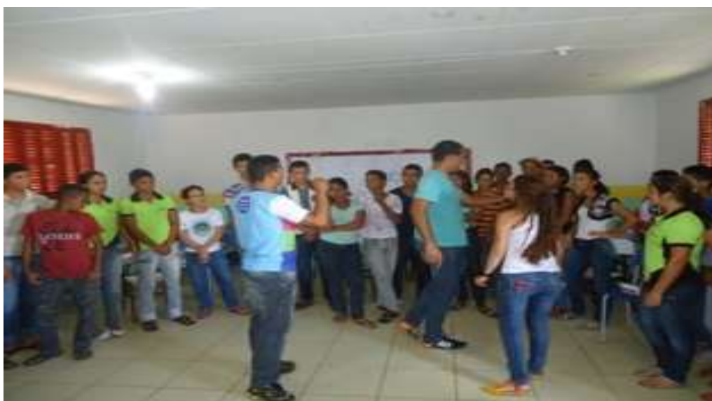
FOTO 1: Apresentação dos participantes e mediadores (Dinâmica).