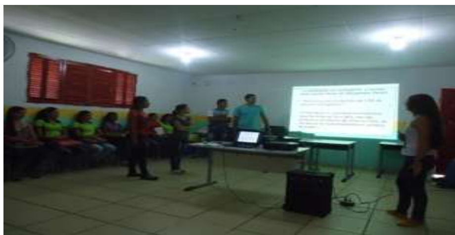
FOTO 2: Exibição e discussão dos temas abordados.