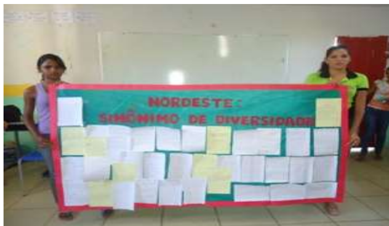
FOTO 4: Pannel com trabalhos feitos pelos alunos.