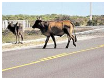
Proprietários dos bichos podem responder a inquérito após flagrante

Os acidentes provocados por animais soltos nas pistas são mais frequentes nas BRs 230 e 104, além das rodovias