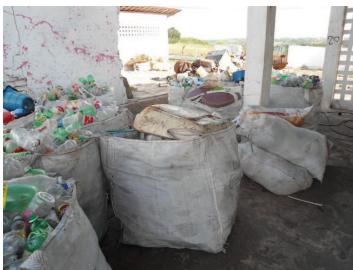
FIGURA 07: Material destinado à reciclagem, separado em sacos

A reciclagem é uma forma particular de reaproveitamento da matéria-prima, tais como: papel, alumínio, vidro, plástico e outros, onde é produzida uma nova quantidade de materiais a partir do material coletado e reprocessado para ser comercializado (MOURA, 2000). Conforme Valente e Grossi (1999), “a reciclagem não diminui apenas a quantidade dos resíduos, como também economiza energia, água e matéria-prima, assim como reduz a poluição do ar, do solo e da água”.