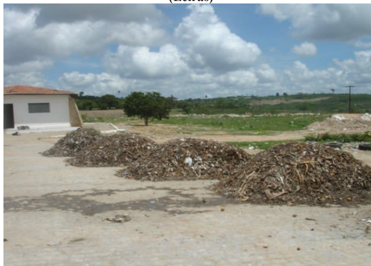
FIGURA 02: Usina de triagem e compostagem de Esperança - PB em 2007 (Leiras)