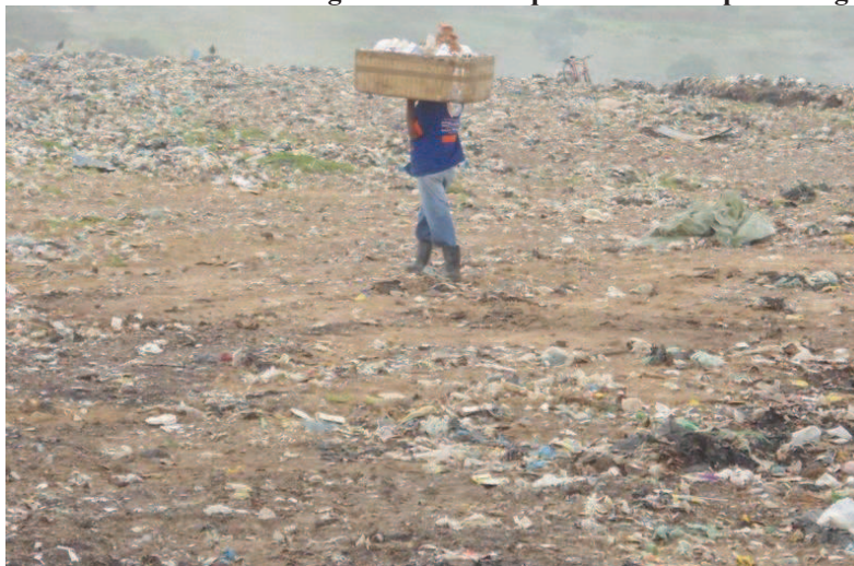
FIGURA 05: Catador carregando material que será levado para triagem