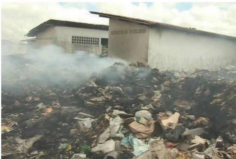
FIGURA 03: Usina desativada em 2012