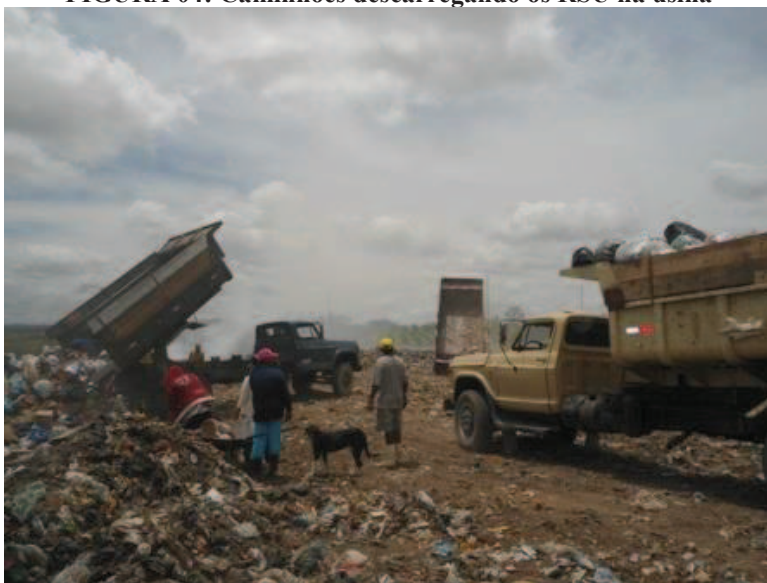
FIGURA 04: Caminhões descarregando os RSU na usina

Após os caminhões despejarem os resíduos, os catadores se deslocam até esta área para separar parte dos resíduos e levá-los até o galpão, para que lá ocorra a triagem (Figuras 04 e 05).