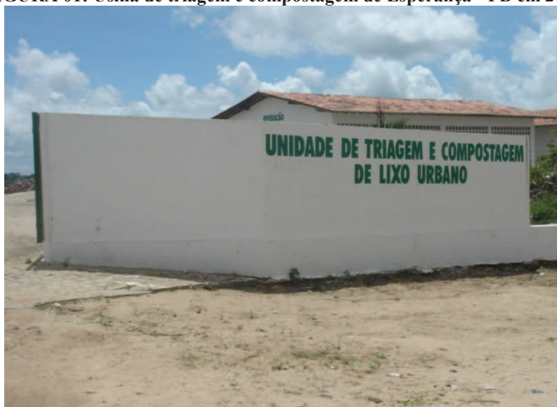
FIGURA 01: Usina de triagem e compostagem de Esperança - PB em 2007