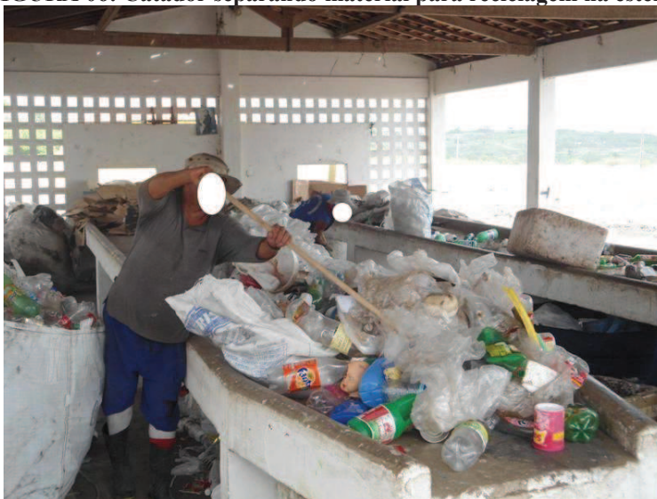
FIGURA 06: Catador separando material para reciclagem na esteira

danos causados ao meio ambiente e diminui o uso dos recursos naturais através da reciclagem, visando qualidade de vida para as atuais e futuras gerações.