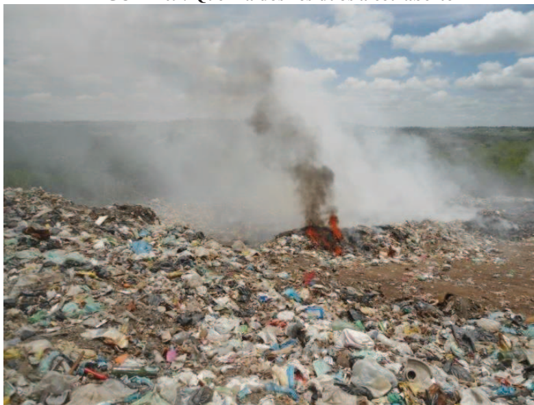
FIGURA 09: Queima dos resíduos a céu aberto

A única maneira de diminuir a quantidade de resíduos é através da queima, (Figura 09) mas, por ser feita de forma inadequada, esta queima só gera poluição no ar, mau cheiro e desconforto para os proprietários de terras localizadas aos arredores da usina.