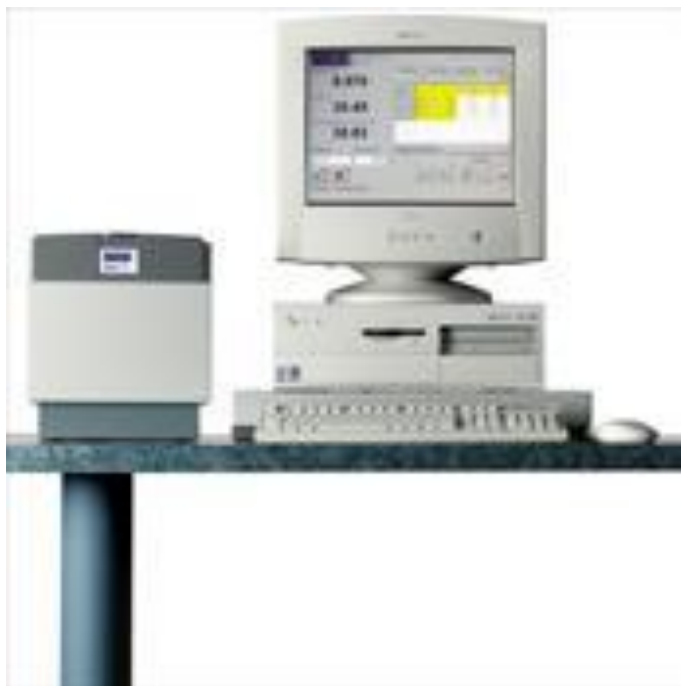
FIGURA 3- Aparelho de Ressonância Magnética - Oxford MQA 7005.