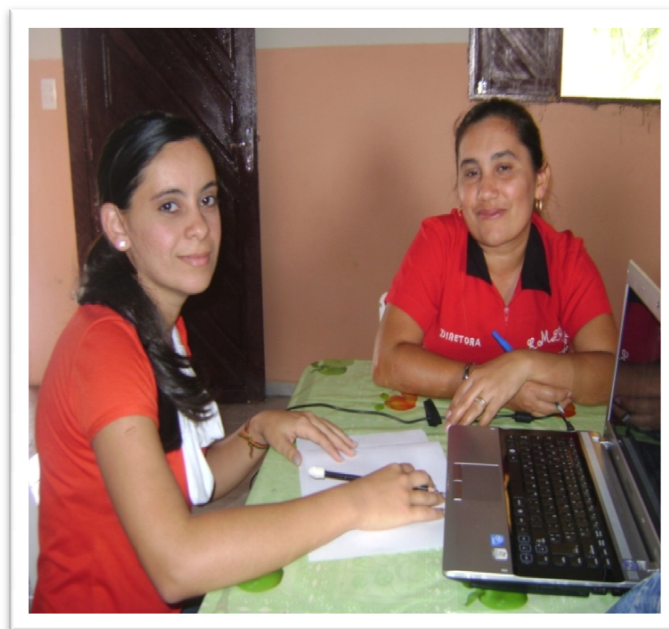
Figura 5. Fotografia da entrevista com a gestora. Fonte: Arquivo da Autora, maio/2014.

decisão foi acatada pelo poder público da época, a gestora é prestadora de serviço. A entrevista trouxe alguns subsídios para compor esse capítulo (Figura 05):