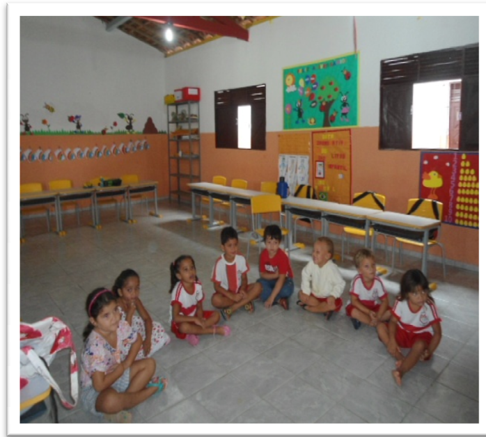
Figura 6. Conhecendo o próprio corpo e suas expressões. Fonte: Arquivo da autora, Agosto/2013.

Nesse contexto, as atividades foram desenvolvidas por etapas, fazendo com que as crianças avançassem em relação à figura humana por meio do desenho, a interferência gráfica foi colocada previamente no papel, colagem de partes do corpo humano e desenhar o corpo humano. Notou-se a necessidade de atividades que envolvesse o movimento e a música.