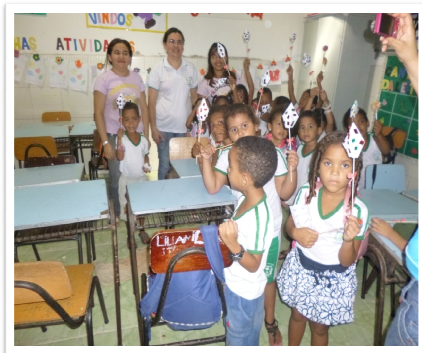
Figura(01)Arquivo da autora – junho de 2013

Das atividades desenvolvidas em nossa sala de aula, podemos expor aqui algumas delas que foram de grande valia para a aprendizagem dos educandos. Nesta atividade podemos observar crianças confeccionando balões, elas aprendem brincando. De maneira participativa e criativa desenvolvendo assim suas habilidades e coordenação através da ludicidade. (Figura 01).