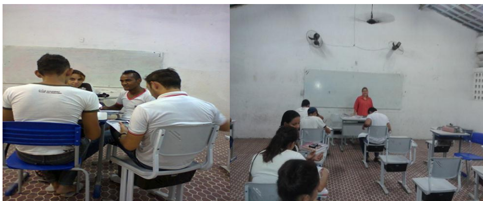
Figura 1- Trabalho em equipe com os alunos

sistematização das aulas, e até mesmo uma avaliação, a fim de testar se as minhas orientações tinham sido compreendidas, como se ver nas fotos e tabela abaixo.