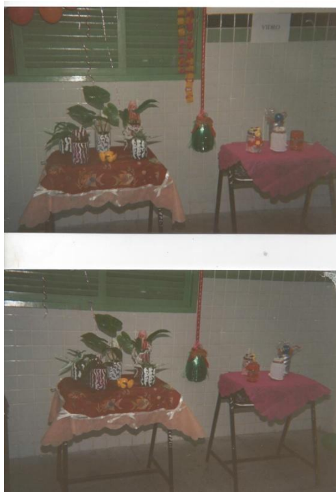
Foto – 2 Confeção de Jarros e flores

Sendo assim, as oficinas foram realizadas contando com a participação de todos os alunos que se empenharam para aprender as técnicas. Os alunos aprenderam, as técnicas com facilidade ao longo dos dias e por isso construíram diversos objetos de maneira que no próximo ano inovaremos as oficinas. Conforme figura abaixo: