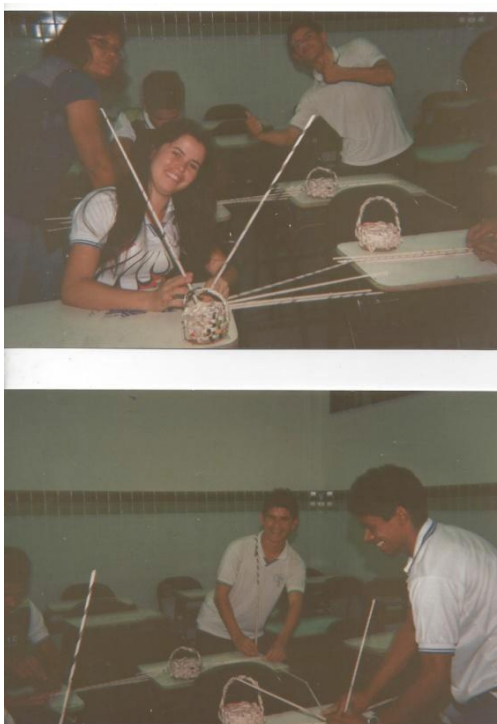
Foto 1- Confeção de cestas

Neste contexto, é necessário ainda desenvolver a criatividade dos alunos e valorizar suas ideias e percepções. Vimos, na proposta da autora citada que, a importância dos procedimentos metodológicos oferece ao aluno e a diversidade dos materiais, fornece os suportes, bem como desafios que favorecem o crescimento do educando. Posto isto, é preciso primar por um ambiente que estimule a criatividade e permita a exploração de novos conhecimentos. Valorizar o desenho na escola é o princípio que impulsiona as demais produções a serem realizadas pelos alunos. Essa valorização pode ser visualizada através das fotos destacadas abaixo: