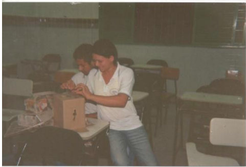
Foto – Confeccção de cestas