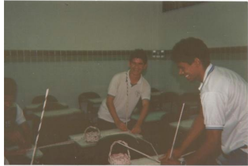
Foto – Confeccção de cestas