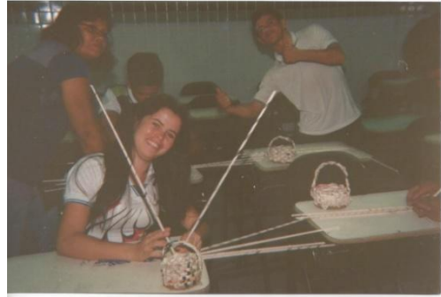
Foto – Jarros e flores