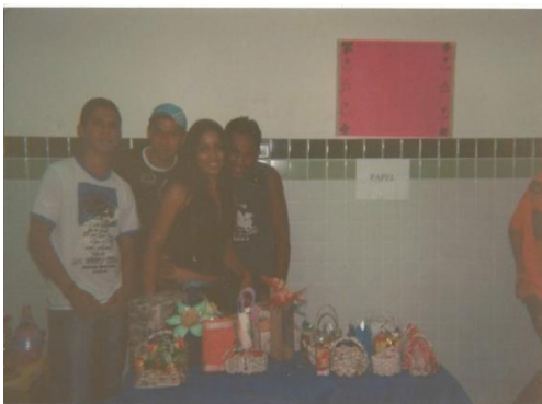
Foto – jarros e flores