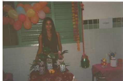
Foto – Jarros e flores