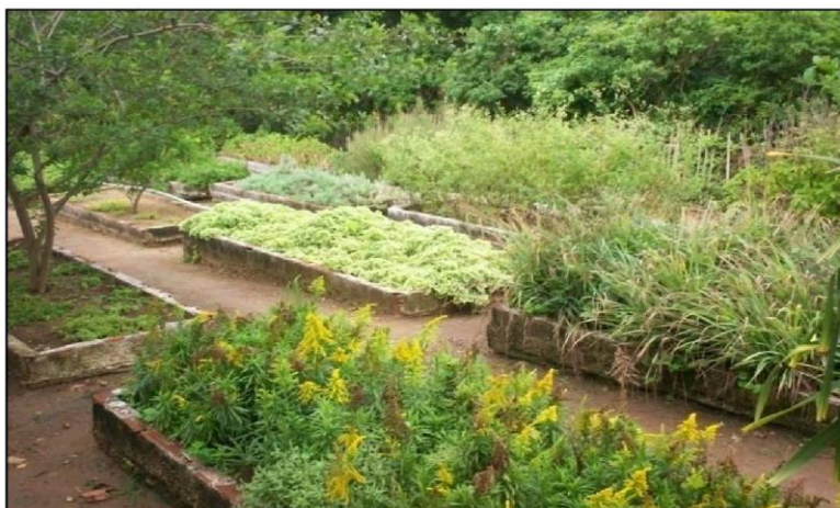
Figura 1 - Horta do Centro de Estudo e Pesquisa Malaquias