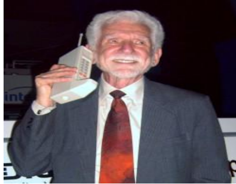
FOTO 2 - Um dos primeiros aparelhos de celular

Entre os anos 1947 e 1973, as fábricas tiveram grande evolução nos aparelhos, porém, a empresa Motorola foi que apresentou um aparelho funcionando (Dyna TAC/ 8000x) o modelo protótipo.