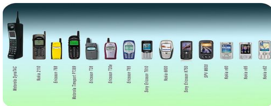
FOTO 3 - http://www.techtudo.com.br/artigos/noticia/2012/06/historia-dos-telefones-celulares.html

A partir da década de 90 as novas gerações de aparelhos com tamanhos que facilitava a mobilidade proposta pelas ideias originais, foram multiplicadas rapidamente entre as classes sociais mais elevadas.