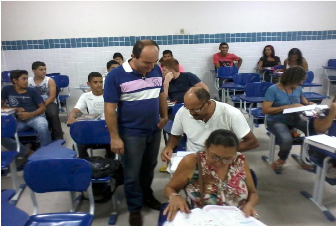
FOTOGRAFIA 2: Tirando dúvidas dos alunos após explicação do assunto.