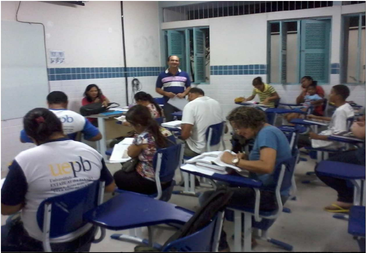
FOTOGRAFIA 3: Concentração dos alunos em resposta as atividades do livro didático