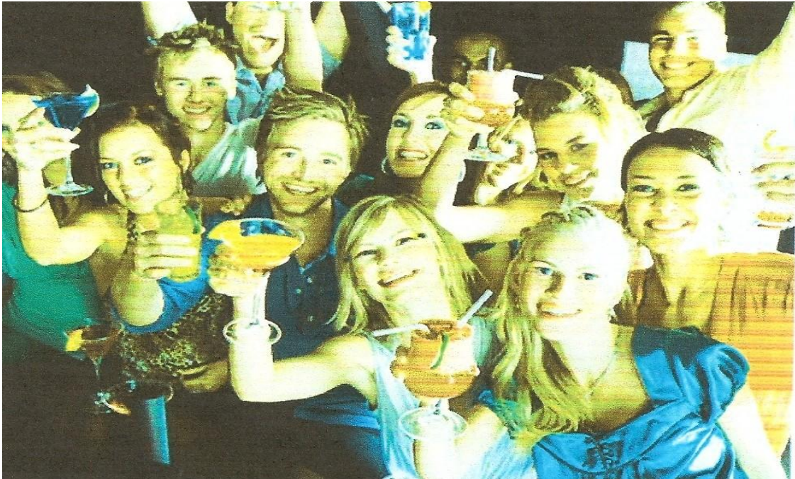
Figura 7 Imagem representando uma festa

No sétimo texto, foi apresentada à turma uma foto de uma festa, como segue abaixo, para que eles formulassem problemas: