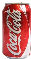
Figura 8 Coca Cola

Como oitavo texto foi utilizado uma lata de coca cola como segue abaixo, para que as equipes formassem problemas.