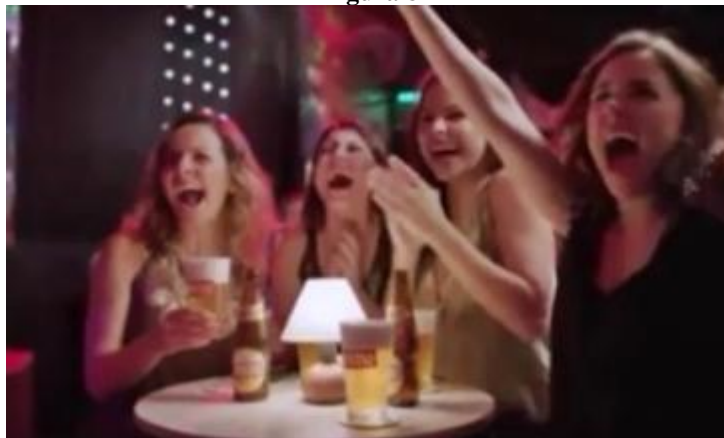
Campanha "Vingança" da cerveja Crystal - 2013

A esposa feliz e eufórica na mesa com suas amigas, de repente recebe uma ligação de seu marido: