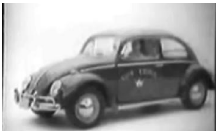
Campanha Fusca VW com Regina Duarte – 1965.

O comercial se inicia com a garota entrando no carro com certo estranhamento, como se aquela situação não fizesse parte de seu cotidiano. Então ela é questionada pelo narrador: