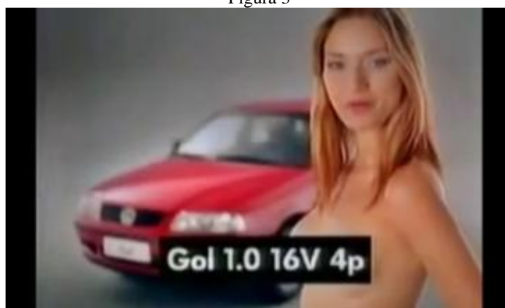
Campanha Gol “Geração Striptease” – 2000.

A imagem feminina é associada diretamente ao produto, por seu caráter sedutor e fetichista, a mulher despida de roupas inicia falando do veículo e à medida que os acessórios e vantagens em relação aos demais carros vão aparecendo, ela surge vestindo peça por peça e gradativamente compõe sua imagem com vestes. Segue sua fala: