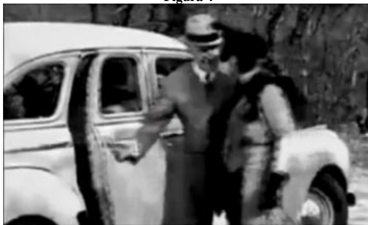
Campanha “Feliz dia da Mulher” da Volkswagen – 2010.

A primeira mensagem da campanha e que aparece escrita em branco em um fundo preto diz: “No Dia Internacional da Mulher, um comercial para ajudar os homens”. A ideia abordada já mostra que a publicidade apesar de ser em especial para o Dia da Mulher (08 de março), é dirigida ao público masculino, seu público-alvo, com dicas e reforçando os rótulos historicamente atribuídos aos homens e mulheres em suas interações. O narrador masculino segue dizendo: