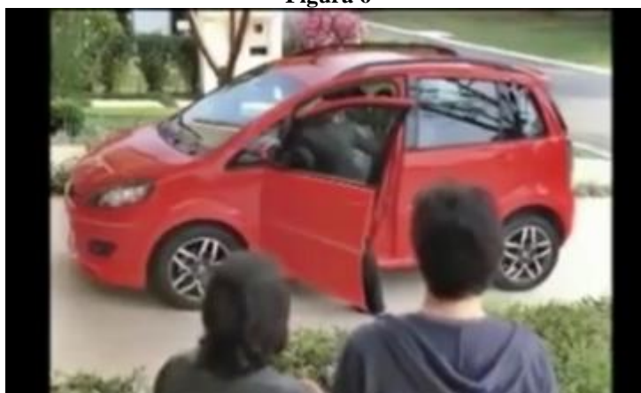
Campanha de lançamento do Fiat Idea no Brasil - 2011