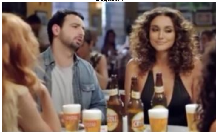
Campanha "Apelidos" da cerveja Crystal - 2013

O primeiro comercial tem 30 segundos e seu principal ambiente é um bar, onde o marido está curtindo o momento na companhia de belas mulheres a quem ele atribui apelidos