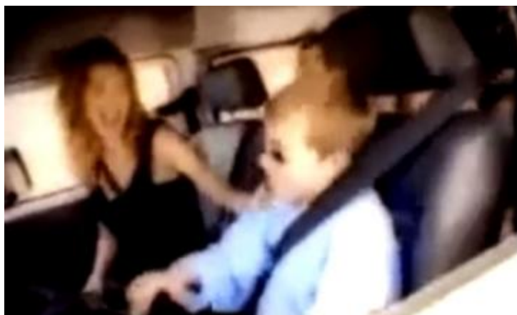
Campanha Mulheres Kombi VW – 1997.

A propaganda se inicia pelo diálogo entre dois meninos colegas de turma, vestidos com fardamento e mochila escolar que então eles conversam: