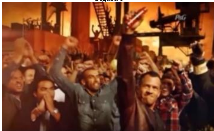
Campanha “O Chamado” do desodorante Old Spice - 2014

Na primeira cena, um homem barbudo e aspectos viris exhibe seu corpo forte em uma praia deserta, e num fantástico golpe daqueles que lembram filme de ação, acerta um coqueiro e derruba um coco, e com outro golpe, desta vez com as mãos, abre o coco e ao beber o líquido de dentro ouve um som que funciona como “o chamado” para todos os homens, então ele sai em sua direção. Sobre as imagens representando a força masculina, Bourdieu (2010, p. 16) observa, “é interessante analisar alguns simbolismos dotados de significação sexual – o movimento sexual para o alto sendo, por exemplo, associado ao masculino, como a ereção, ou a posição no ato sexual”.