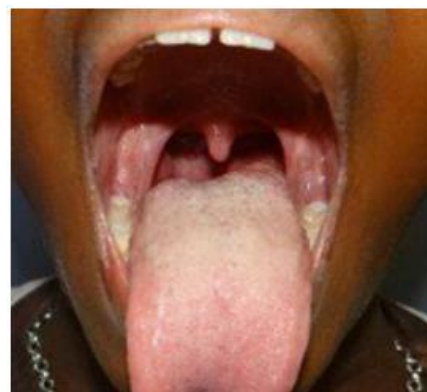
Figura 3: Pós operatório

terceira etapas as doses foram de 2 ml do agente esclerosante diluídos em 2 ml de glicose (50%) cada. Antes de cada aplicação do agente esclerosante, foram feitas infiltrações ao redor da lesão com lidocaína. Com o início do tratamento, a