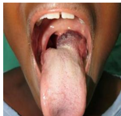
Figura 1: Imagem inicial

Ao exame clínico, observou-se uma lesão nodular de base séssil, limites bem definidos, localizado na região posterior esquerda de dorso lingual, de coloração arroxeada, consistência flácida e doloroso à palpação (Figura 1). Não havia presença de ulceração, sangramento ou infecção na área afetada. O diagnóstico definitivo de hemangioma foi estabelecido diante os achados clínicos e realização da vitropressão.