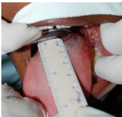
Figura 2: Transoperatório

Diante dos achados clínicos, pode-se sugerir presença de hemangioma. Sendo desta forma o tratamento de escolha, feito através da utilização de agentes esclerosantes.