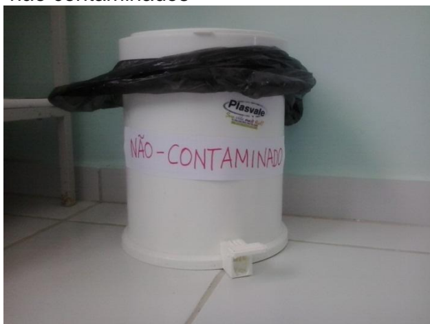
Figura 7 - recipiente destinado a resíduo não contaminados Figura 8 - recipiente destinado a RSS.

Os recipientes específicos para descarte de materiais perfurocortantes (agulhas, seringas, laminas de bisturi, vidraria quebrada, entre outros) não eram preenchidos acima do limite de 2/3 de sua capacidade total e foram colocados sempre próximos do local onde é realizado o procedimento. As Figuras 7 e 8 ilustram a forma correta de se armazenar cada tipo de resíduo.