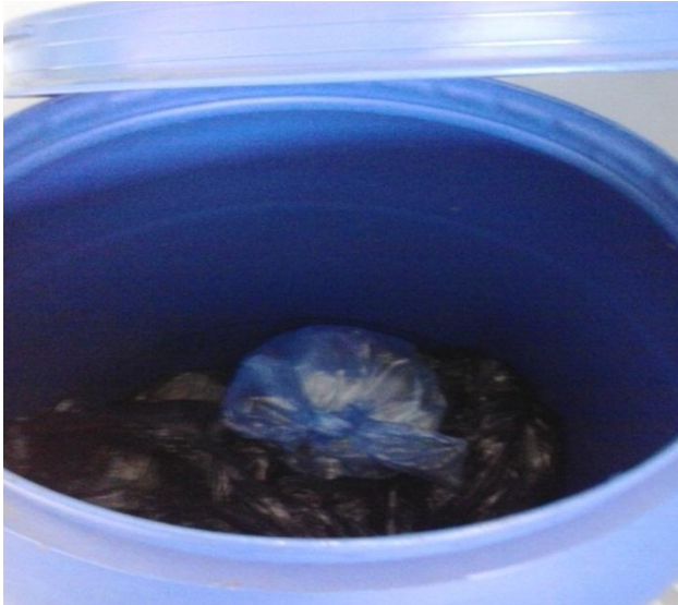
Figura 2 - resíduos descartados em sacos inadequados para RSS

sua capacidade total. A Figura 2 apresenta os resíduos descartados em sacos inadequados para RSS na unidade de saúde de Queimadas-PB.