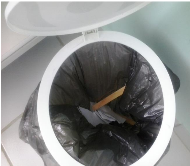
Figura 3- resíduos contaminados colocados junto a resíduos comuns.

Os RSS devem ser depositados em sacos brancos leitosos específicos para esse tipo de resíduo, na Figura 2 observa-se esses resíduos depositados em sacos para lixo comum. A Figura 3 e 4 ilustra os resíduos contaminados colocados junto a resíduos comuns na unidade de saúde de Queimadas-PB.