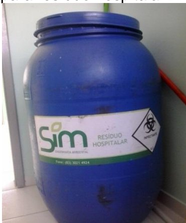
Figura 12 - bombona 200L, destinada para resíduo hospitalar

Como ilustrado nas Figuras 12 e 13 são nestas bombonas que são depositados apenas RSS e a empresa responsável pela coleta recolhe o resíduo contaminado uma vez por semana, e leva até sua unidade de tratamento. O destino final do resíduo produzido na unidade de saúde é a incineração sob a responsabilidade da empresa contratada para a coleta.