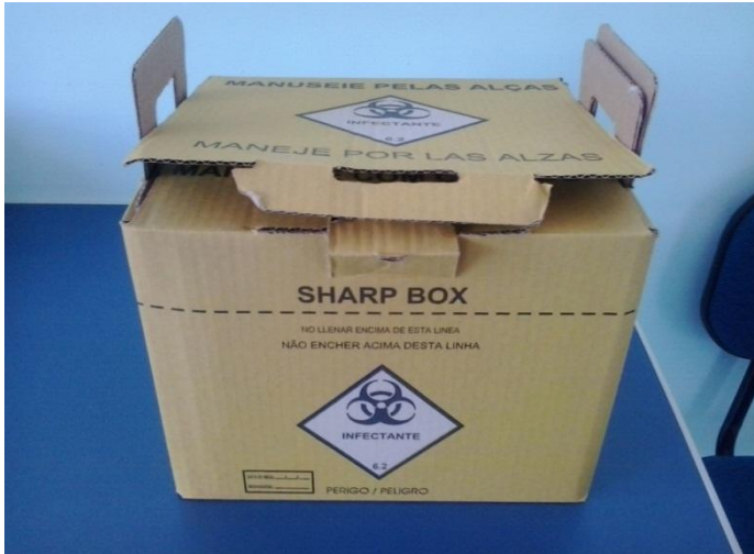
Figura 6 - DESCARTEX