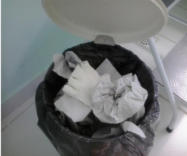
Figura 4 - resíduos descartados inadequadamente