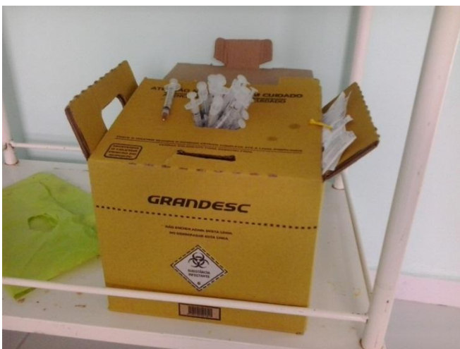
Figura 1 - Descartex destinado a resíduos perfurocortantes

Os resíduos comuns são coletados por uma equipe da prefeitura, e são destinados ao lixão do município. A Figura 1 apresenta o recipiente descartex destinado a resíduos perfurocortantes da unidade de saúde de Queimadas-PB.