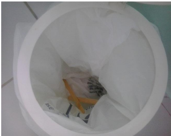
Figura 9 - resíduo contaminado