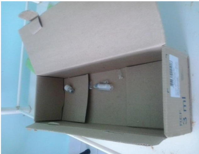
Figura 5 - Resíduos perfurocortantes armazenados inadequadamente

Verifica-se nas Figuras 3 e 4 que os RSS estão inadequadamente depositados em saco inadequado para estes resíduos, além de estarem colocados junto a resíduos não contaminados. A Figura 5 apresenta os resíduos perfurocortantes armazenados em recipiente inadequado.