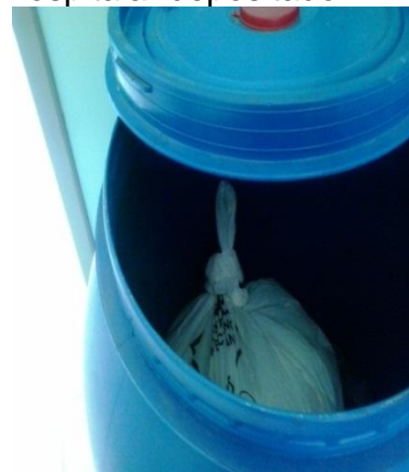
Figura 13 - bombona com resíduo hospitalar depositado