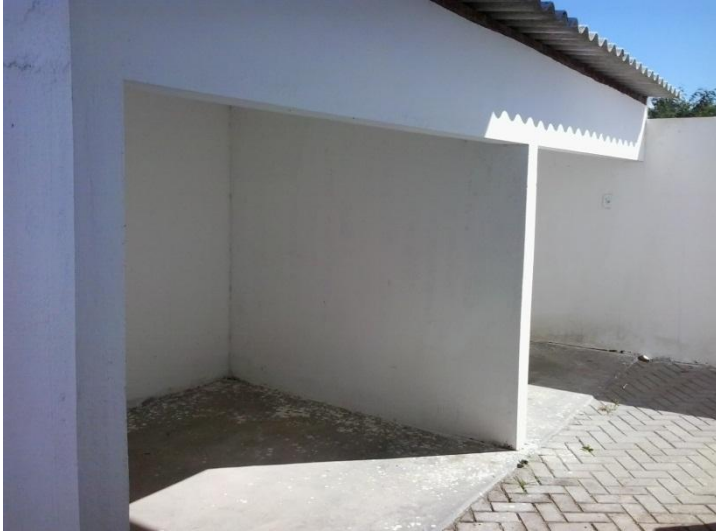
Figura 14 - local destinado para armazenamento externo dos resíduos

Na unidade de saúde da cidade de Queimadas ainda está sendo construído um local adequado para o armazenamento temporário, externo dos resíduos produzidos por esta unidade de saúde como ilustra Figura 14.