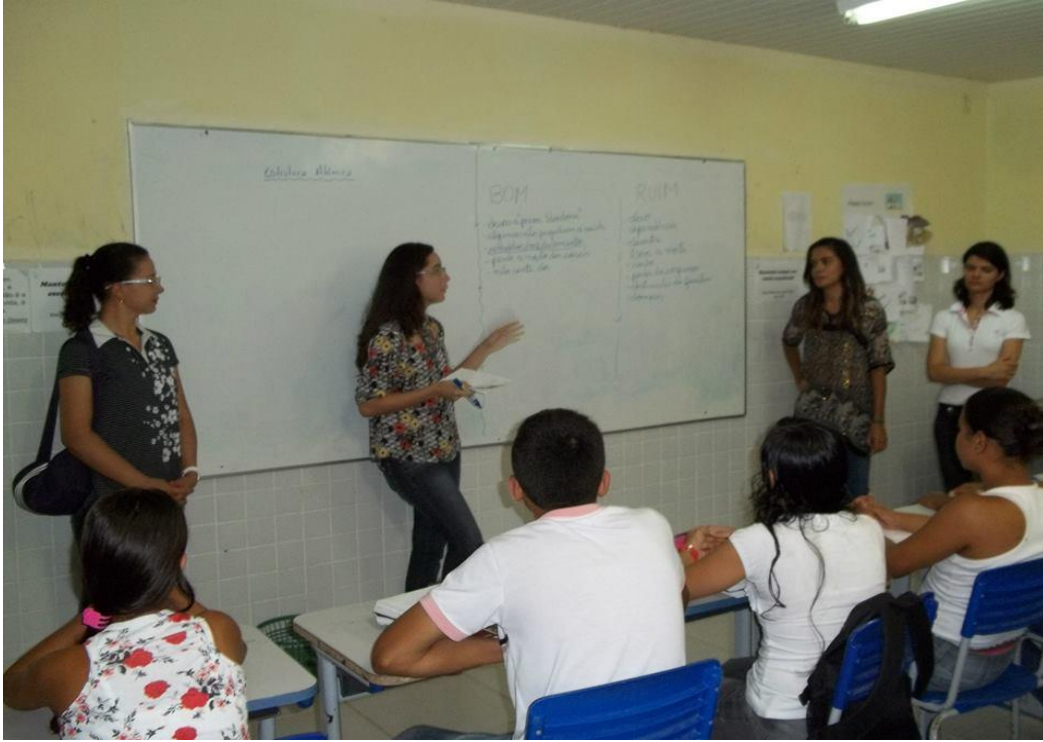
Atividade educativa com o 1º ano A