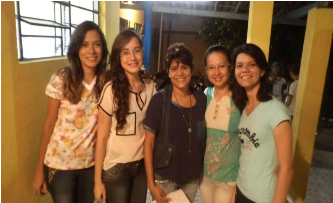
Equipe de estagiárias do EMI