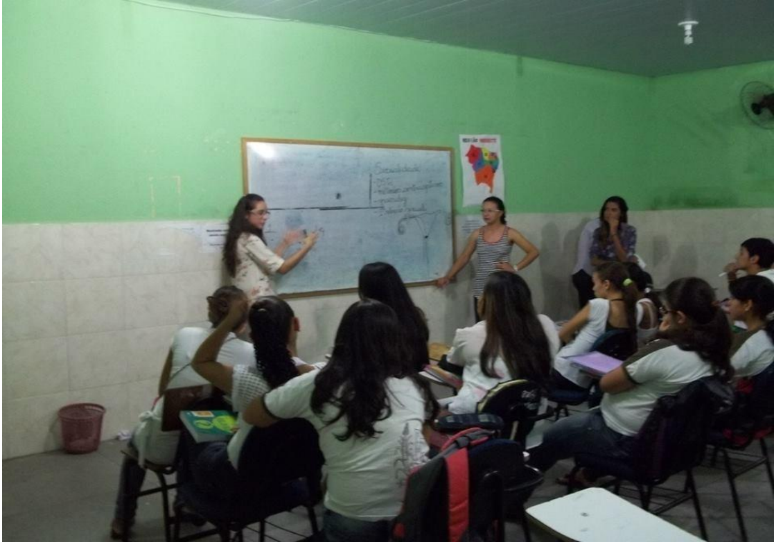
Atividade educativa com o 2º ano A