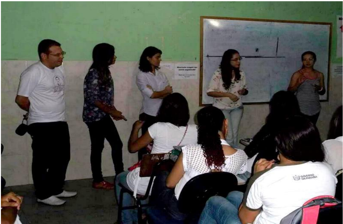
Atividade educativa com o 2º ano A