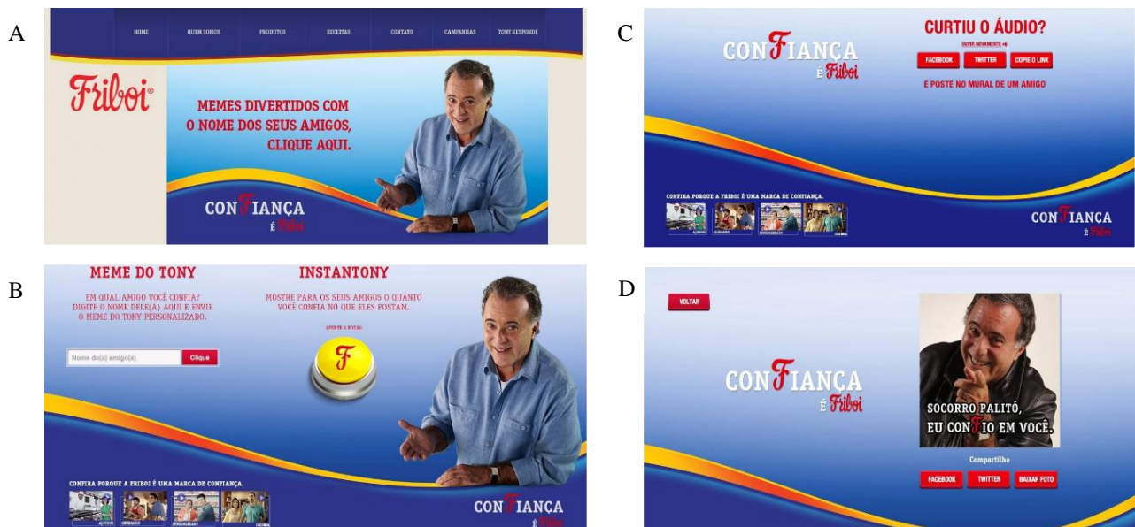
Figura 14 –Memes: Página inicial do site Friboi (A); Memes: À esquerda, local de personalização do meme. À direita, local de reprodução do áudio (B); Áudio: após apertar o botão referido na ilustração (B), gera-se essa nova pagina a qual o áudio pode ser devidamente compartilhado (C); Memes: Após seleção do nome é gerado o meme, e logo abaixo do meme as opções de compartilhamento, vale ressaltar que os memes possuem variações nas frases formadas (D).