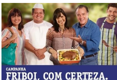
Figura 6 - Friboi, com certeza.