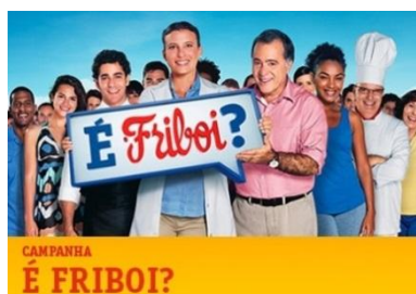
Figura 5– É Friboi?