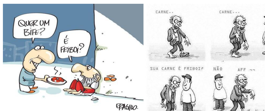
Figura 13 – Memes ressaltam que acima de qualquer circunstância a carne precisa ser Friboi para ser consumida.

O sucesso dos memes foi tão gigantesco que até mesmo a própria marca entrou nesse circuito, passando a criar memes em seu próprio site para sempre publicados nas redes sociais e até mesmo ser baixado como foto em aparelhos eletrônicos, os memes do site foram intitulados como “Meme do Tony”. No site foi depositado também um formato de áudio intitulado como “Instantony” – que reproduz uma frase dita pelo ator Tony Ramos - “Opa, ai eu confio”, que pode ser, do mesmo modo, compartilhado e baixado. Tornando-se uma publicidade compartilhada, como pode ser observado nas Figuras 15 14.