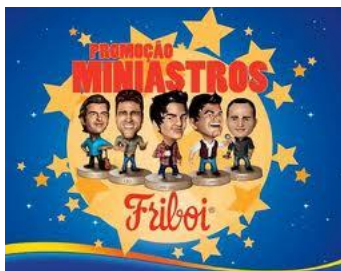
Figura 1– Miniastros.