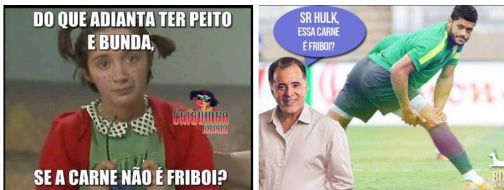
Figura 10 - Memes transmitindo a conotação de que para ser um “produto” de qualidade, precisa ser Friboi.

do povo, trazendo assim, um pouco de graça para as campanhas. Conforme observado nas Figuras 14 abaixo.