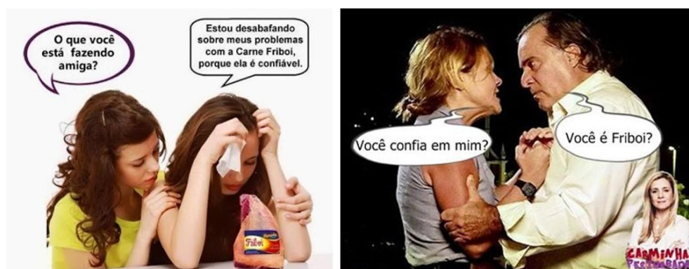
Figura 11 - Memes que giraram em torno da campanha – “Friboi. Carne confiável tem nome”.