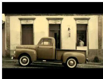
Figura 2– Vai Zé.