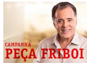
Figura 3– Peça Friboi.