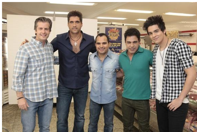
Figura 8 - Victor e Léo; Luan Santana e Zezé de Camargo e Luciano.