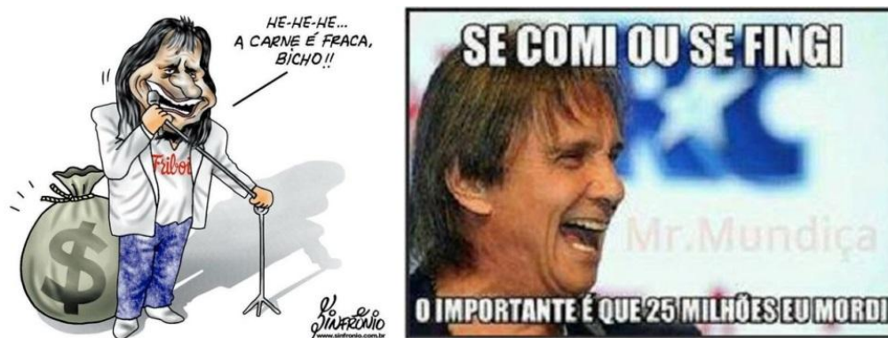
Figura 12 - Memes que surgiram em decorrência aos aspectos negativos apresentados na campanha estrelada pelo cantor Roberto Carlos.