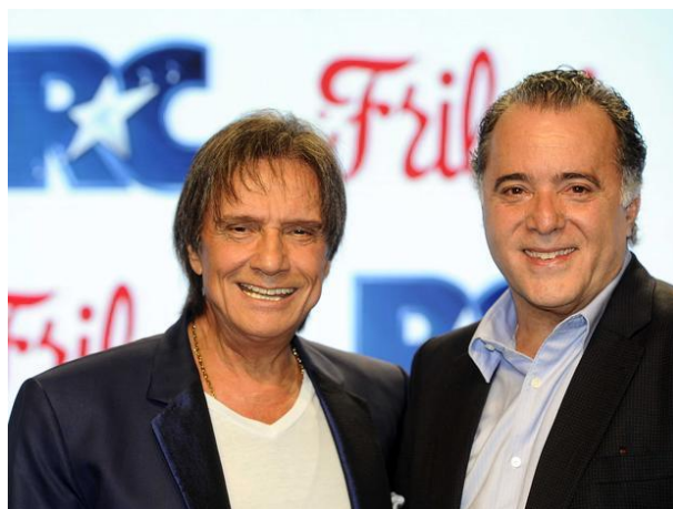
Figura 9 – Roberto Carlos e Tony Ramos

Nem sempre essas participações repercutem da forma como se programa, uma participação que trouxe preocupação para a empresa foi o anúncio estrelado pelo cantor Roberto Carlos, que era vegetariano há 30 anos, e voltou a “comer carne” especialmente pouco antes de estrelar o comercial da Friboi. O anúncio não convenceu e a publicidade não repercutiu como a empresa esperava, e antes mesmo do contrato acabar a publicidade saiu do ar.