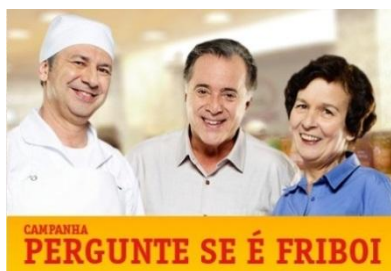
Figura 4 - Pergunte se é Friboi.