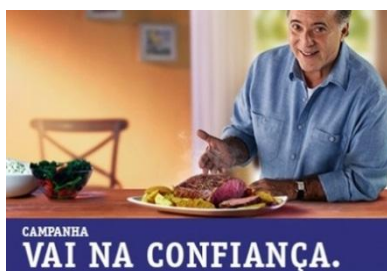
Figura 7-Vai na confiança.

E em todas as campanhas o anunciante preza pela aproximação dos fatos mencionados a vida real, busca levar, o consumidor para o ambiente de construção da empresa, para que com isso, a sua confiança seja aguçada e assim sinta-se como parte integrante daquele ambiente que ali está sendo apresentado. Pois, o grau de confiabilidade é uma das questões mais favoráveis na hora da aquisição do produto.