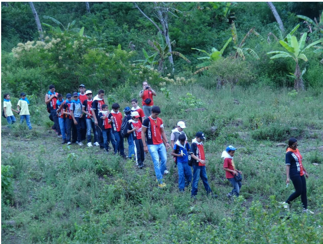
Figura 2 - Alunos na caminhada ecológica.