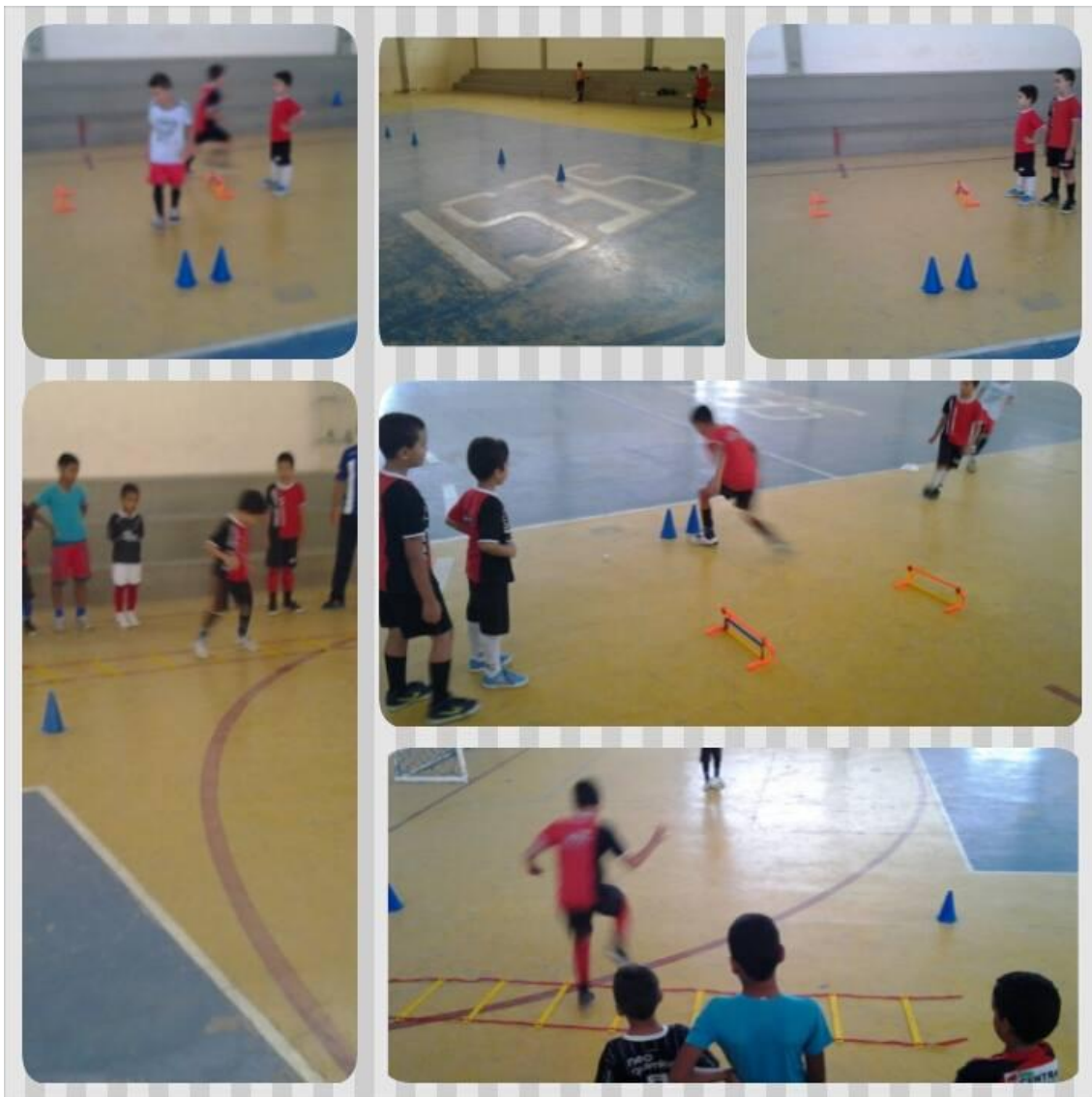
Figura 1 - Alunos participando de um circuito locomotor.