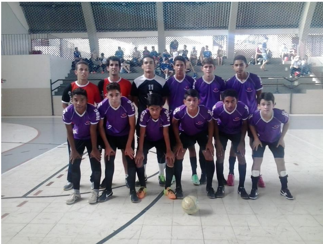
Figura 3 - Competição jogos do SAF.