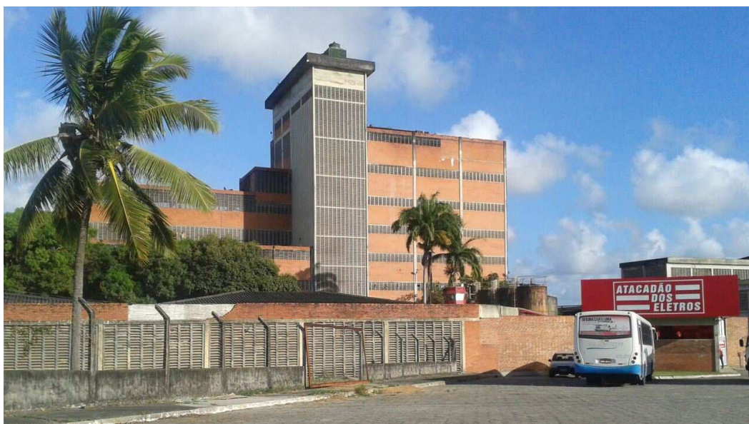
Figura: 1 Fachada da empresa.

O setor pesquisado foi o jurídico, situado na BR 101 Bairro das Indústrias, km 04, João Pessoa PB. Pode-se ver abaixo na figura 1.