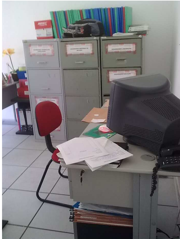
Figura 3: Panorama do setor jurídico em 2010