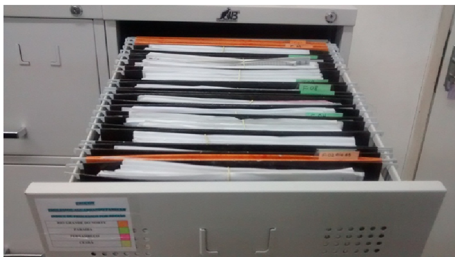
Figura 8: Organização documental - fichário

Como se pode visualizar na figura 8, os processos encontram-se organizados em pastas suspensas por cor discriminando o estado e tem um índice de identificação nas gavetas de todos os armários.