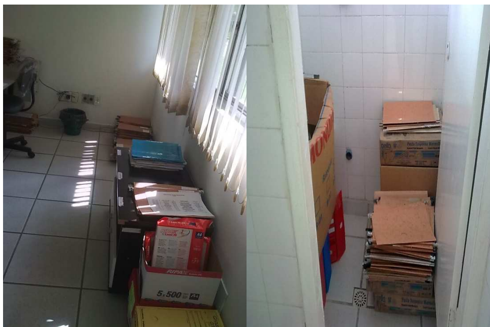
Figura 5: Panorama do chão do setor jurídico em 2010

Neste período os documentos ficavam espalhados pelo chão da sala do setor do banheiro como se pode ver na figura 5 e dentro de caixas de papelão sem identificação. Nos três armários haviam papéis colados com fita adesiva, contendo os nomes das movimentações dos processos que havia dentro das gavetas, nas pastas suspensas.