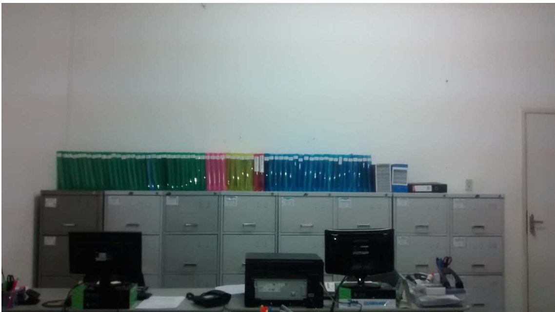
Figura 6: Visão Parcial do Arquivo