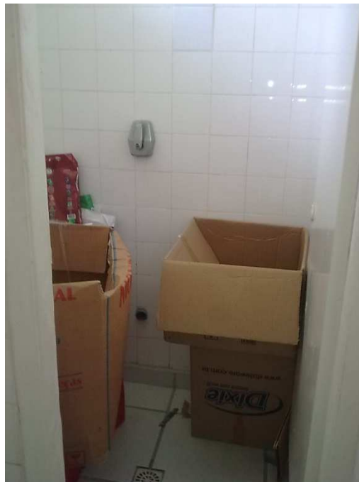
Figura 4: Panorama do banheiro do setor jurídico em 2010