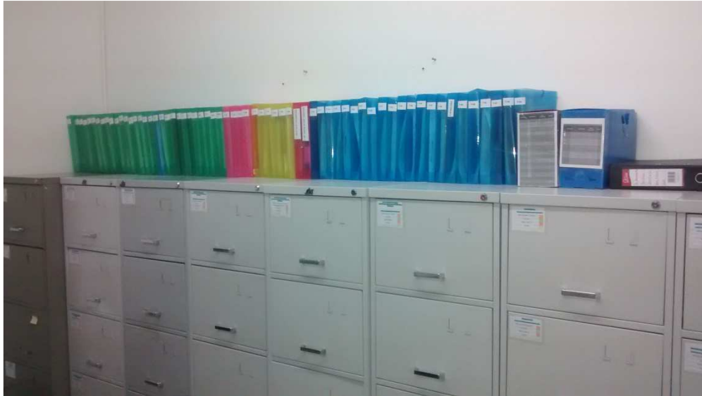
Figura 7: Arquivo Corrente Jurídico- contratos de locação e prestação de serviços