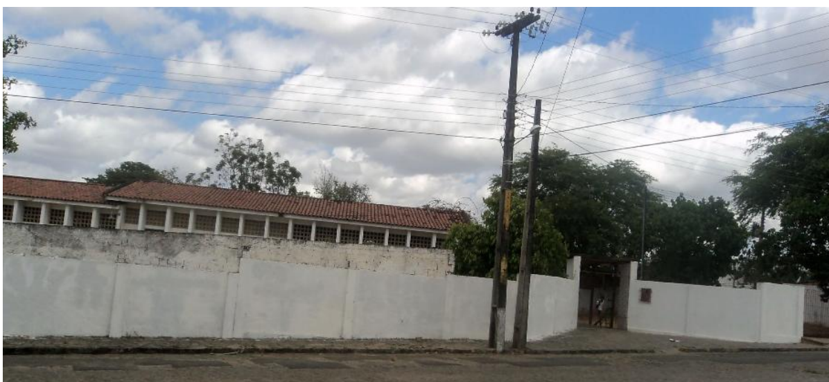
Figura 02 - Entrada da Escola Antônio Oliveira.