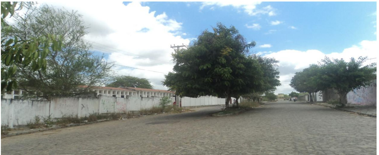
Figura 01 - Rua: Alberto Santos, Escola Antônio Oliveira.

A escola campo de estágio funciona regularmente em três turnos. No turno da manhã atende a quatrocentos e cinco alunos, o turno da tarde atende a cento e vinte oito alunos e o turno da noite atende a duzentos e trinta e cinco alunos, totalizando setecentos e sessenta e oito alunos matriculados no ano letivo de 2014. Abaixo apresentamos uma fotografia ( Figura 01 ) com a rua onde está situada a escola na qual realizamos as atividades do estágio.