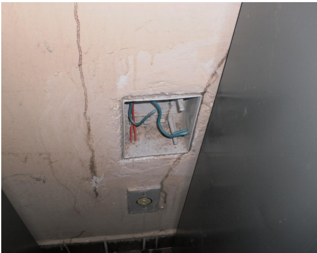
Paredes com instalações elétricas e traços de cupins. Fotos (julho de 2009)