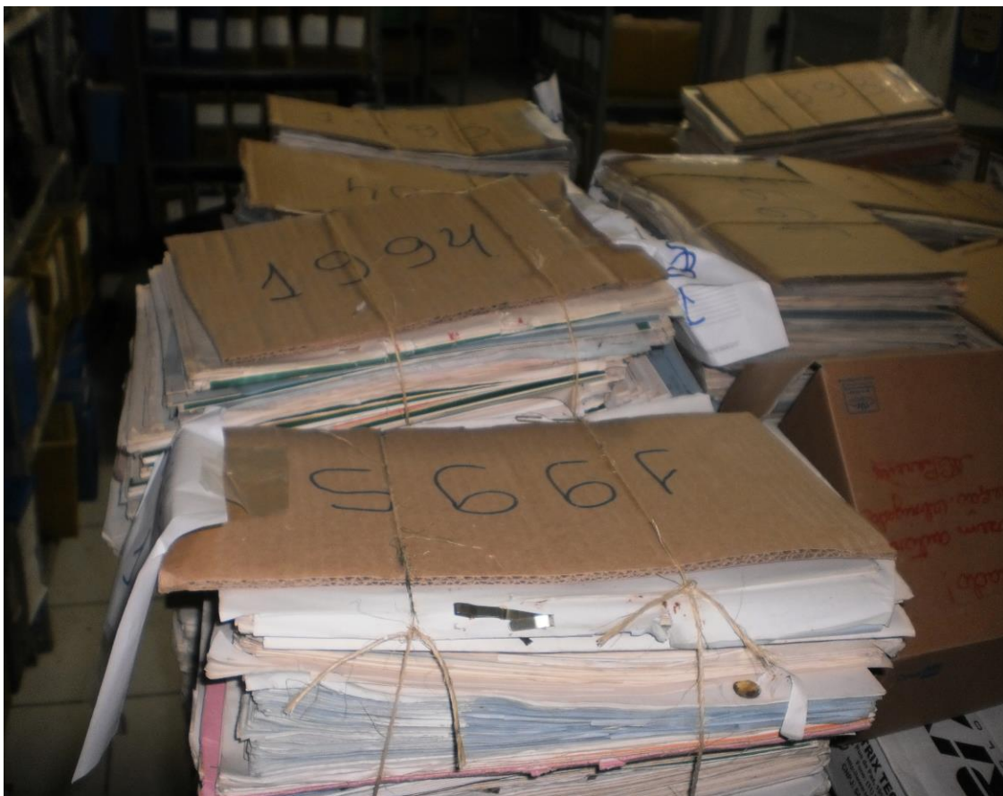
Documentos totalmente inadequados, Fotos (julho de 2009)