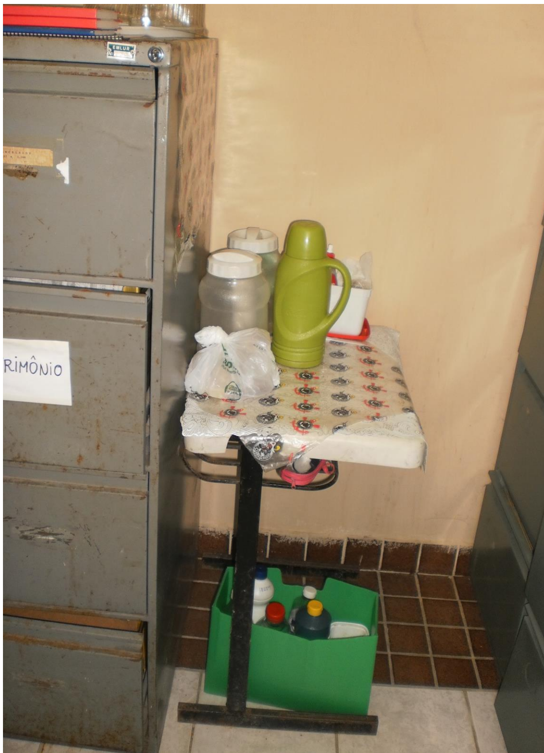
Porta arquivo enferrujados juntamente com alimentos e material de limpeza. Fotos (julho de 2009)