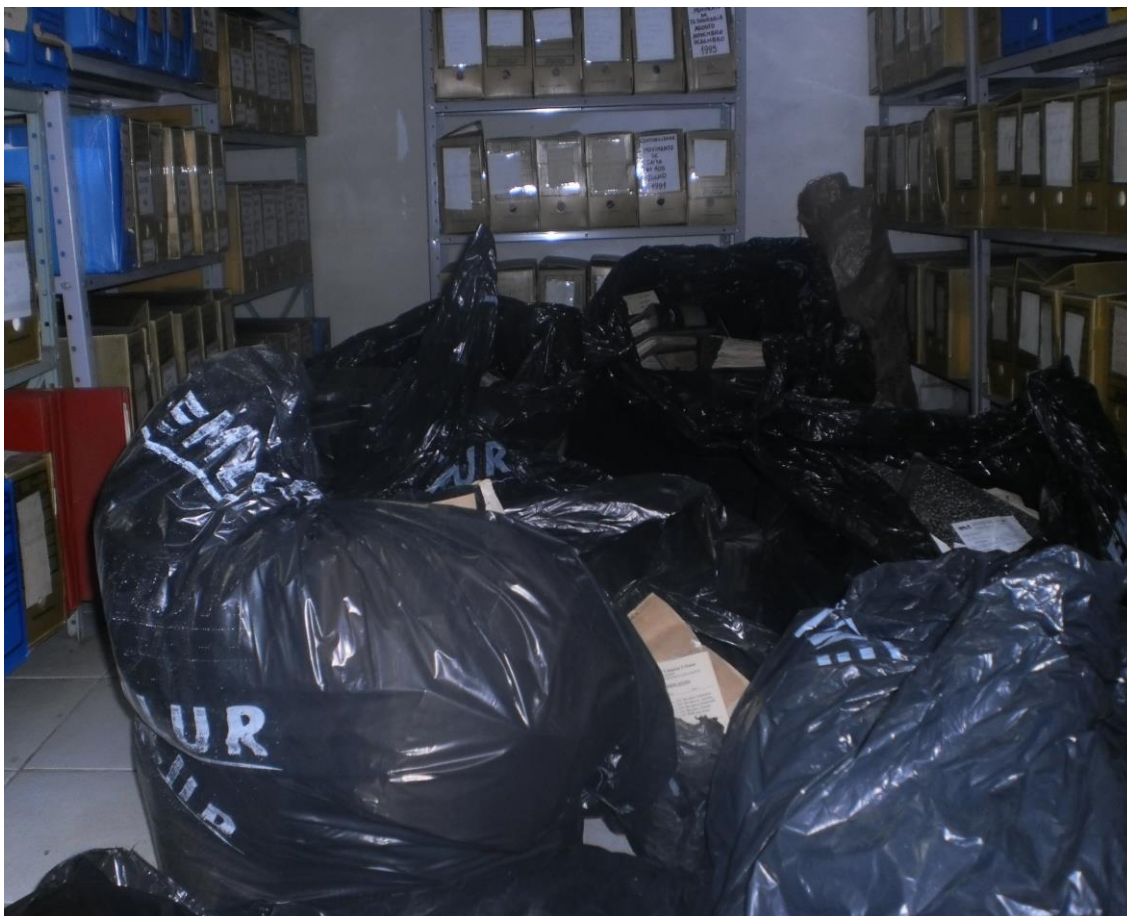
Sacos de lixo com documentação desde 1991. Fotos (julho de 2009)