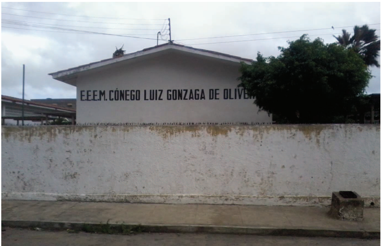
Figura 1 – Fachada da Escola Estadual de Ensino Médio e Fundamental Cônego Luiz Gonzaga de Oliveira.

Tendo em vista o crescimento populacional do bairro de Mangabeira, no ano de 2000, por ordem da SEE, a escola passou a oferecer apenas o EM à comunidade. Posteriormente, no ano de 2013 foi implantado na escola o ProEMI, passando a funcionar em tempo integral no período diurno. Já no período noturno, a escola oferece o EM na modalidade Ensino Regular e Educação de Jovens e Adultos (EJA).