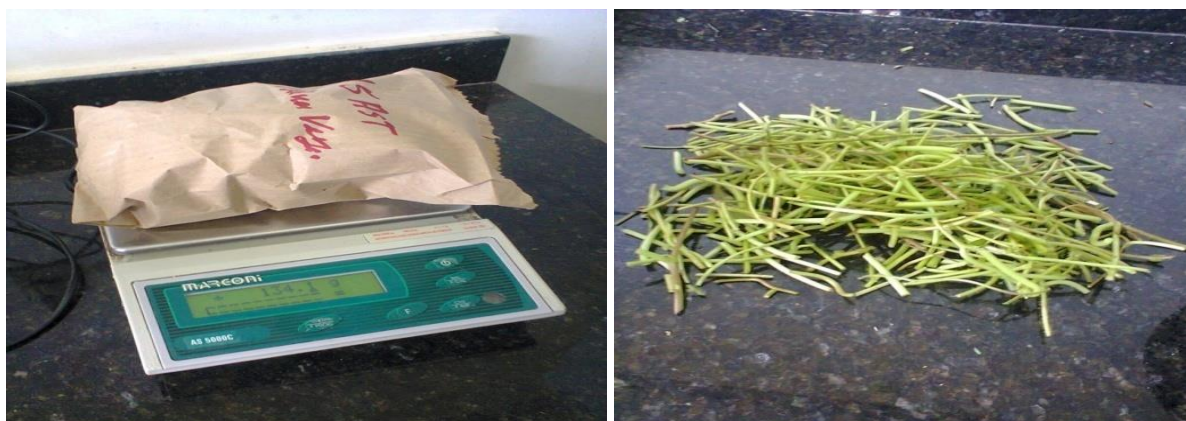
Figura 3. Pesagem e separação das folhas e haste para determinação da relação F/H

O delineamento experimental utilizado foi inteiramente casualizado, onde os tratamentos corresponderam aos tempos de secagem com quatro repetições/tratamento.