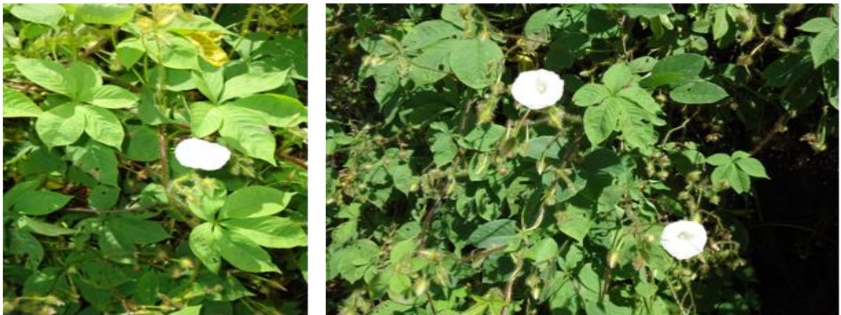
Figura 1. Plantas de Jitirana em áreas de ocorrência natural em Catolé do Rocha-PB/2015

O material para confecção do feno foi cortado quando constatado que cerca de 10% do stand de jitirana apresentava-se em floração (Figura 1).