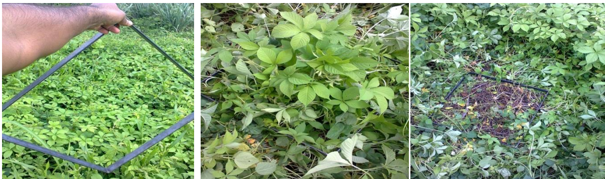
Figura 2. Coleta da jitirana em áreas de ocorrência natural da espécie para estimativa da produtividade e relação folha/haste.

Na área da moldura foi coletado todo o material vegetal da jitirana, acondicionado em sacolas plásticas e posteriormente transportado para o Laboratório de Fisiologia Vegetal. Chegando ao laboratório pesou-se o material e posteriormente iniciou-se a separação das folhas e hastes para se determinar as proporções das mesmas. Após separação (Figura 3) foram acondicionadas em sacos de papel devidamente identificados, pesados e colocados para secar em estufa a 55°C e posterior determinação da relação F/H.